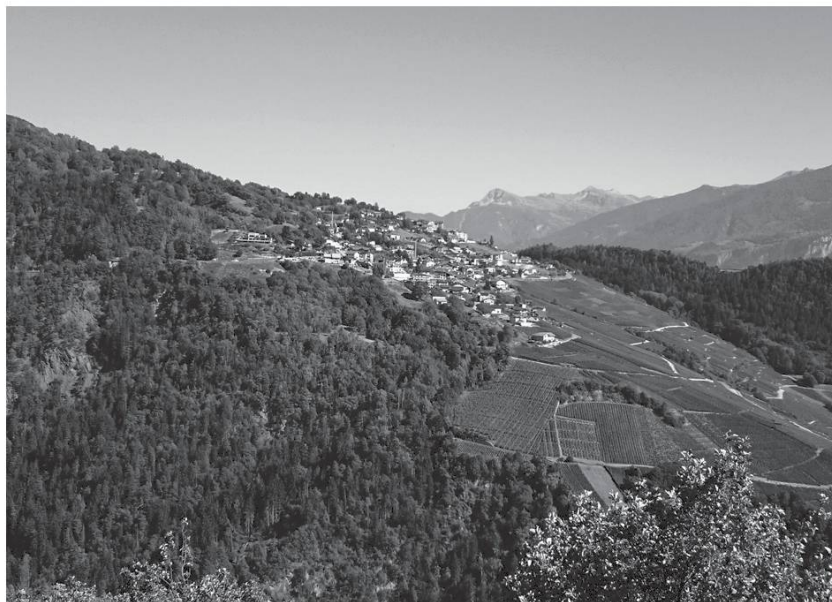
Village de Chandolin (Savièse).

Les paysans des différents villages de Savièse en partance pour les mayens de la vallée de la Morge transportaient leurs marchandises dans les chars jusqu'à cet endroit. De là, la route étant plus raide, le mulet était dételé, on lui endossait le bât et les « bechatsé » dans lesquelles on fourrait les marchandises à acheminer au chalet. Les chars vides étaient mis à l'abri sous cette pierre, pour autant qu'il y avait encore de la place.