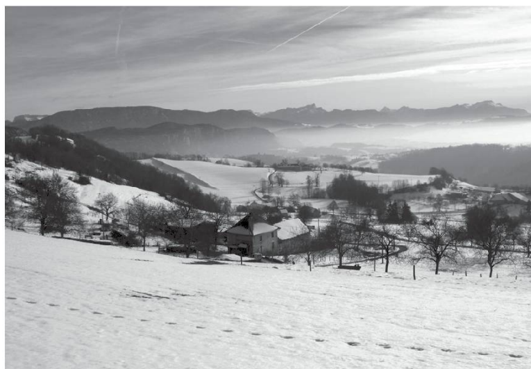
Le Rocheron et Chartreuse au loin.