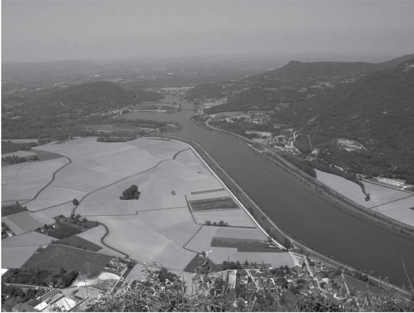
Le Rhône vu des falaises.