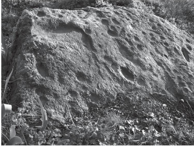
Pierre à cupules du Rocheron.