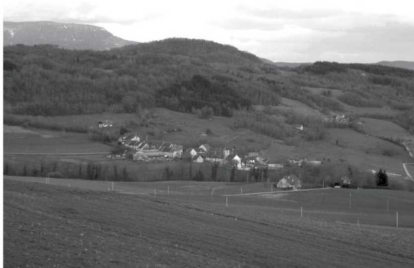
Chef-lieu de St-Maurice.

Le site de Conspectus a été fouillé au début des années 2000 : une tour carrée de 8 m de côté avec murs de 1 m d'épaisseur, construite au XI e siècle sur une base plus ancienne et détruite par un incendie au XIV e s. Les murs restants font encore 3 m de haut. Du sommet de la tour, on pouvait voir très loin dans toutes les directions.