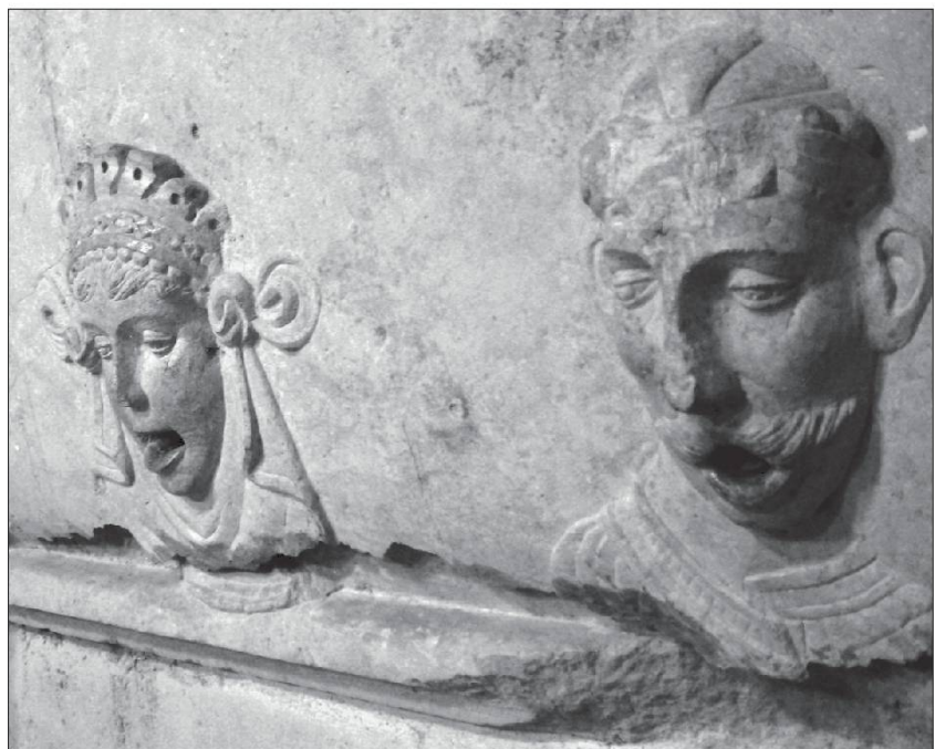
Fontàn.na pae Tomar (Portugal).

Bîn s'vent l en n'écoute pu les ouïnnous , bien souvent on n'écoute plus les râleurs.