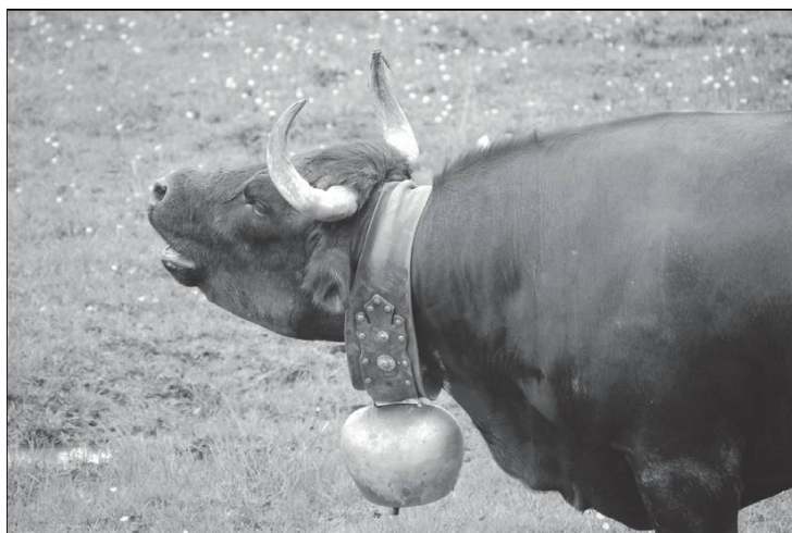
Tsanfleuron, 2009.