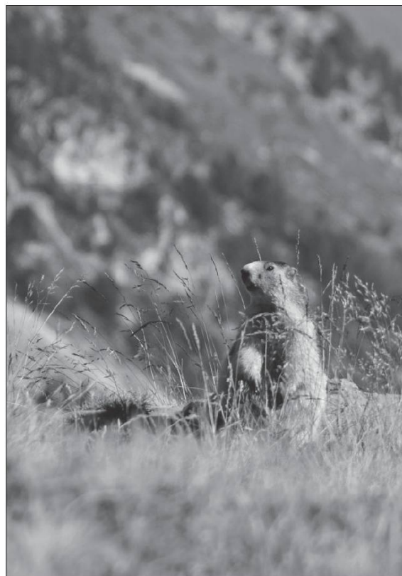
La marmôta seblè , la marmotte siffle.

À noter la tchèvréla (la chouette hulotte) ainsi nommée car son chant rappelle le bêlement de la chèvre.