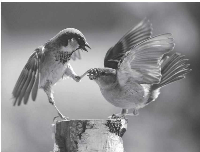
Luz uèjè tsanton , les oiseaux chantent.

Lò tsén' dzapè , le chien jappe ; â sè dèkouè , il hurle à la mort, il « se décourage » ; a dzèmèlyè kin âl é malòdò, a nyoulè kin a rèchèye on kou dè pya , il gémit quand il est malade, il pousse un cri aigu quand il reçoit un coup de pied.