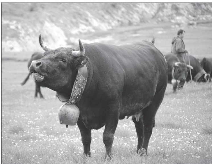
I atse bramé. Photo Bretz, Tsanfleuron, 2009.

Couachye , coasser, caqueter, croasser, crier. Ina a son dou piri, l'a oun couan kyé couachyé , au sommet du poirier, il y a un corbeau qui croasse. Le