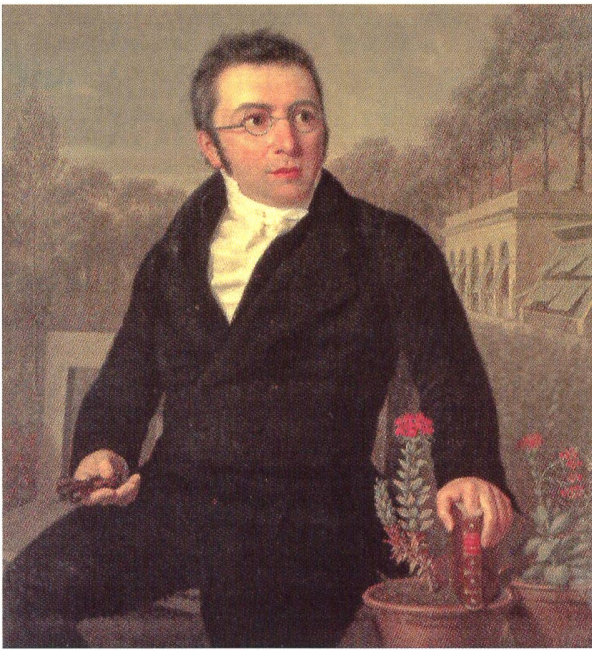
Fig. 2 Augustin-Pyramus de Candolle à 44 ans, tenant la Théorie élémentaire de la botanique dans la main gauche et une loupe dans la main droite, avec pour arrière plan le premier jardin botanique de Genève situé sur l'emplacement actuel du Parc des Bastions. Huile sur toile de Louis Bouvier (1822). Genève, Société des Arts.

œuvre scientifique. De ses premiers travaux anatomiques et physiologiques (ou plutôt de «physique végétale» comme on disait à l'époque) 1 jusqu'à ses dernières publications, consacrées à décrire, nommer et classer l'ensemble des espèces végétales connues à l'époque, Candolle a laissé derrière lui une œuvre qui frappe par son abondance et sa diversité, et qui inclut quelques travaux d'agronomie ainsi que des études visant à améliorer la condition de ses semblables. Son témoignage autobiographique, enfin restituée dans son intégralité d'après le manuscrit conservé dans la famille de Candolle 2 , nous dévoile, par-delà la stature du grand savant, un personnage haut en couleurs, qui avait un goût peu modéré pour les belles femmes, un