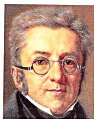
Fig. 1: Portrait d'Augustin-Pyramus de Candolle (détail). Huile sur toile de Joseph Hornung (1839). Genève, bibliothèque publique et universitaire (BPU).