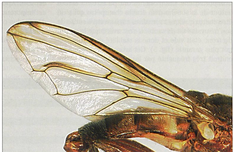
Fig. 4: Brachyopa panzeri Goffe, 1945. Mâle, aile (GE: Genève, Muséum d'histoire naturelle, 11.V.2009).

Syrphidae de Zurich. Brachyopa panzeri appartient aux espèces du genre avec une chète antennaire (arista) plus ou moins nue (cils plus courts que le diamètre de l'arista à la base, voir fig. 3) et un mésonotum (dos du thorax) plus ou moins brun ou peu noirci (figs 1-2). Cette combinaison n'est connue que chez deux espèces: B. panzeri et B. dorsata Zetterstedt. Elles se différencient clairement par la structure de l'appareil génital du mâle (Thompson 1980; Pellmann 1998). En plus, les ailes de B. panzeri sont souvent diffusément brunies au bord et sur la «vena spuria» (nervure au milieu de l'aile qui s'estompe au milieu de la cellule R5) (fig. 4), mais les ailes sont entièrement transparentes chez B. dorsata . Ce dernier caractère manque dans les descriptions récentes (p. ex. Speight 2008) malgré le dessin accompagnant la description de Panzer (1798) qui montre clairement les ailes partiellement sombres.