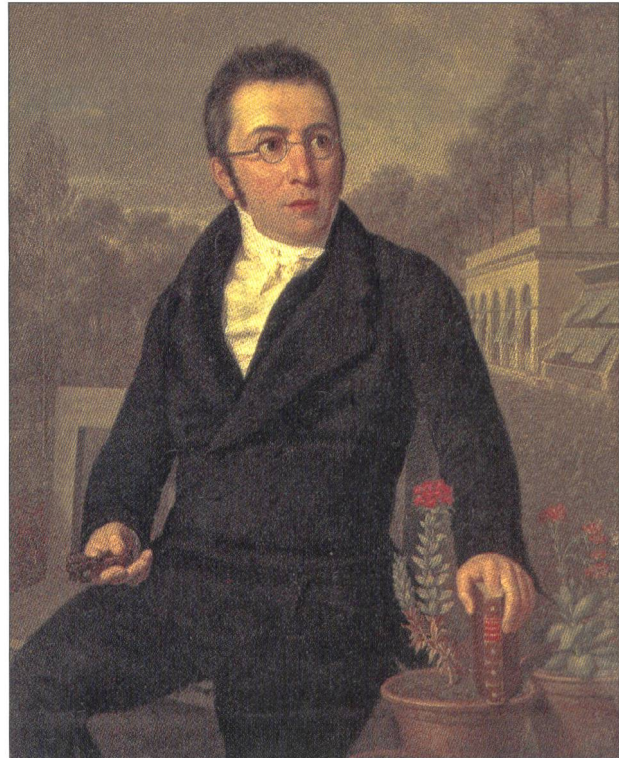
Fig. 1. Augustin-Pyramus de Candolle vers 1822, avec en arrière plan le Jardin botanique des Bastions à Genève. Huile sur toile de Louis Bowier.

Ces propos, qui attestent de la grande déférence de Senebier pour autrui, rejoignent ceux d'Augustin-Pyramus dans son Histoire de la botanique genevoise . Senebier était un savant, y lit-on, «[t]out occupé de la recherche de la vérité, entièrement étranger à toute vanité, [et] il semblait se faire un devoir de mépriser le charme qui résulte d'un heureux choix d'expressions, et lui-même en convenait avec cette naïveté qui le caractérisait et qui désarmait toute critique» 4 . Reconnu par son biographe Maunoir pour son manque de style dans ses écrits scientifiques 5 , que l'historien Sachs qualifiera comme de la «rhétorique délayée» 6 , mais doué dans l'art de la conversation 7 , Senebier détestait tout particulièrement les louanges qui lui étaient portées. C'est ainsi fermement qu'il demande à Candolle dès sa seconde lettre de cesser tous mots élogieux envers lui 8 . La dédicace à son nom du nouveau genre de plante Senebiera par le botaniste genevois le met mal à