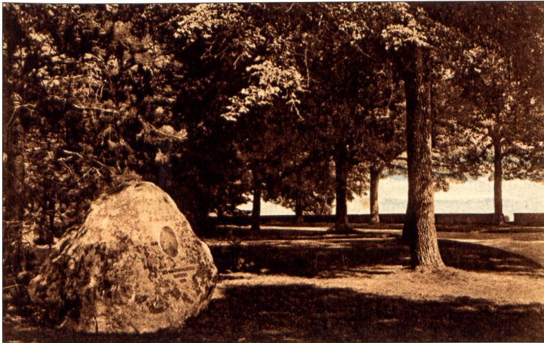
Fig. 2. Carte postale commémorative, 1915, Inauguration à Morges du monument érigé en son honneur par les naturalistes suisses, coll. Famille Forel (photographie Musée du Léman / Aurelio Moccia, dépôt Famille Forel).