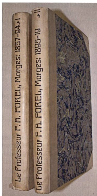
Fig. 1. «Le Professeur F.A. FOREL Morges: 1857-94, I / 1895-19, II», 2 volumes reliés de diplômes et nominations, collection famille Forel (photographie Musée du Léman / Aurelio Moccia, dépôt Famille Forel).