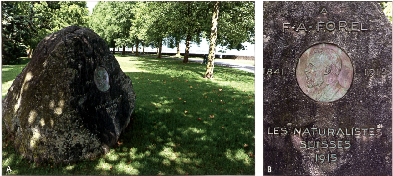
Fig. 3. (A): Le monument érigé à Morges photographié en 2012 (photographie François Forel, 2012 et (B): détail du monument (photographie François Forel, 2012).

Encouragé par son père dès son adolescence à partager sa passion pour l'archéologie, F.A. FOREL fréquente des amis de son père, membres de sociétés savantes. Il a surtout accès à de grandes collections d'objets scientifiques de diverses natures (archéologique, géologique, biologiques ou anthropologiques...). Cette initiation à la classification va être le ferment de la construction d'un esprit extraordinairement méthodique. Il est intéressant de se souvenir qu'il consacre les dernières années de sa vie à classer les collections archéologiques de divers musées, où