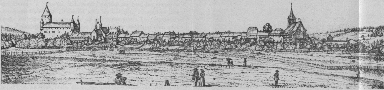
Bulle (côté est) d'après Heerliberger, 1758