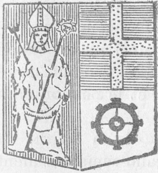
Saint - Blaise