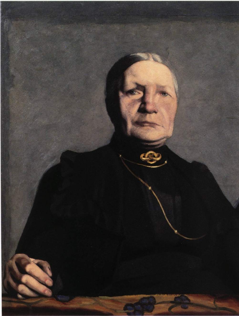
Félix Vallotton (1865-1925) Les parents de l'artiste, détail, 1902 Huile sur carton 83,5 x 117,5 cm MAHF 1991-445.