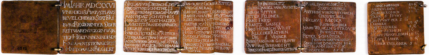
Inconnu, Mémorial du Jaquemart, 1626. Cuiivre, 6,2 x 13,4 cm (ouvert). MAHF 4212

nous concentrer sur les fonctions et charges du pouvoir en détaillant les principales. Pour cela, il suffit de suivre simplement le fil du document dans l'ordre où leurs détenteurs sont présentés.