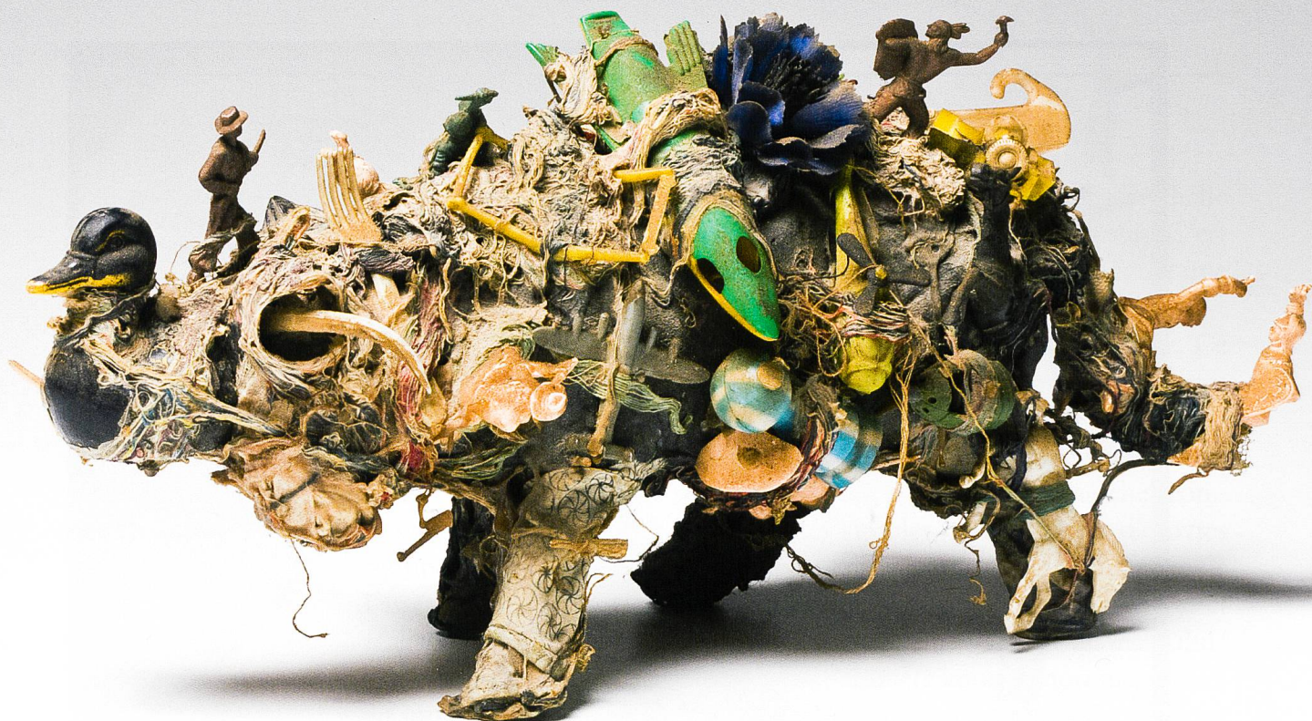
Niki de Saint Phalle (1930-2002) Rhinocéros, années 1960 Technique mixte

Le public oublie souvent que l'art de Saint Phalle ne se laisse pas réduire à des Nanas colorées qui réjouissent petits et grands. Si, à l'instar de Marcello, la femme constitue un thème central pour elle, ce n'est pas l'héroïne mythologique ou historique qui l'intéresse mais la femme dans ses fonctions familiales et sociales, autrement dit la fille, l'épouse, l'amante, la mère, la grand-mère. L'artiste a, certes, toujours souligné son souhait de faire de «l'art pour tous», immédiatement appréciable avec les yeux et le cœur. Mais il existe d'autres lectures passionnantes de ses œuvres destinées à celles et ceux qui connaissent un peu mieux sa vie et ses combats. Les premières œuvres de l'artiste reflètent notamment les démons de ses premières souffrances par l'insertion d'un vocabulaire guerrier. Ces œuvres parfois répulsives extériorisent les abîmes mélancoliques d'une jeune femme pour laquelle l'art est une thérapie lui permettant de se sauver elle-même. Elle y exorcise les violences subies, le viol par son père alors qu'elle avait onze ans, ou plus tard, ses difficultés à réaliser, en parallèle, une carrière d'artiste et un quotidien de mère.