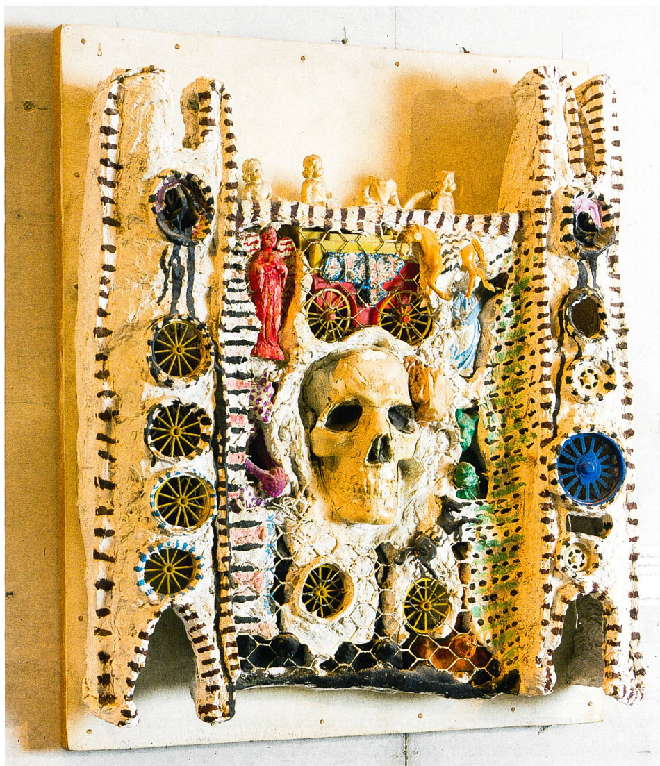
Niki de Saint Phalle (1930-2002) Petite cathédrale, 1962 Technique mixte