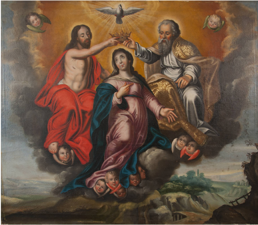
Couronnement de la Vierge, de Pierre Crolot, 1642. Huile sur toile. Tableau principal du retable, chapelle de la Sainte-Trinité-et-de-l'Assomption, Granges-sur-Marly.

dents en chargeant Crolot de peindre les tableaux du retable ornant la chapelle qu'il venait de construire sur son domaine à Granges-sur-Marly, dans les environs de Fribourg.