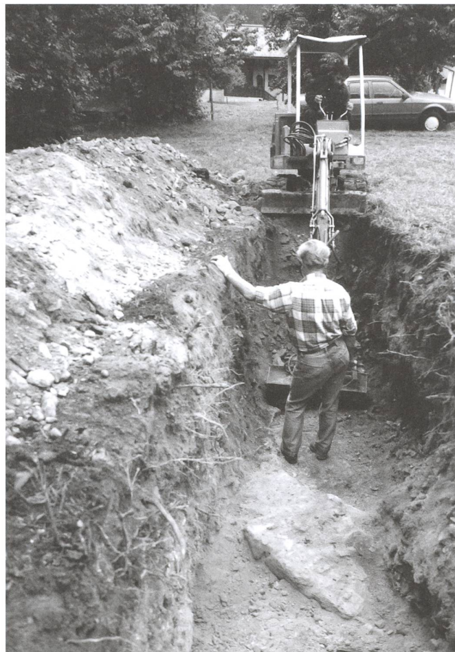
Abb. 4: Tomils, Sogn Murezi 1994. Die maschinellen Aushubarbeiten zur ersten Sondage werden von Sandro Lazzeri vom Archäologischen Dienst Graubünden begleitet.

Die Grabungsarbeiten zur Kirchenanlage dauerten mit mehrjährigen Unterbrüchen bis ins Jahr 2011 an. 4 Die Leitung der Sondierung und der darauffolgenden Grabungskampagnen in den Jahren 1995 und 1996 oblag dem Grabungstechniker Alois Defuns. 1997 wurden die Grabungstätigkei-