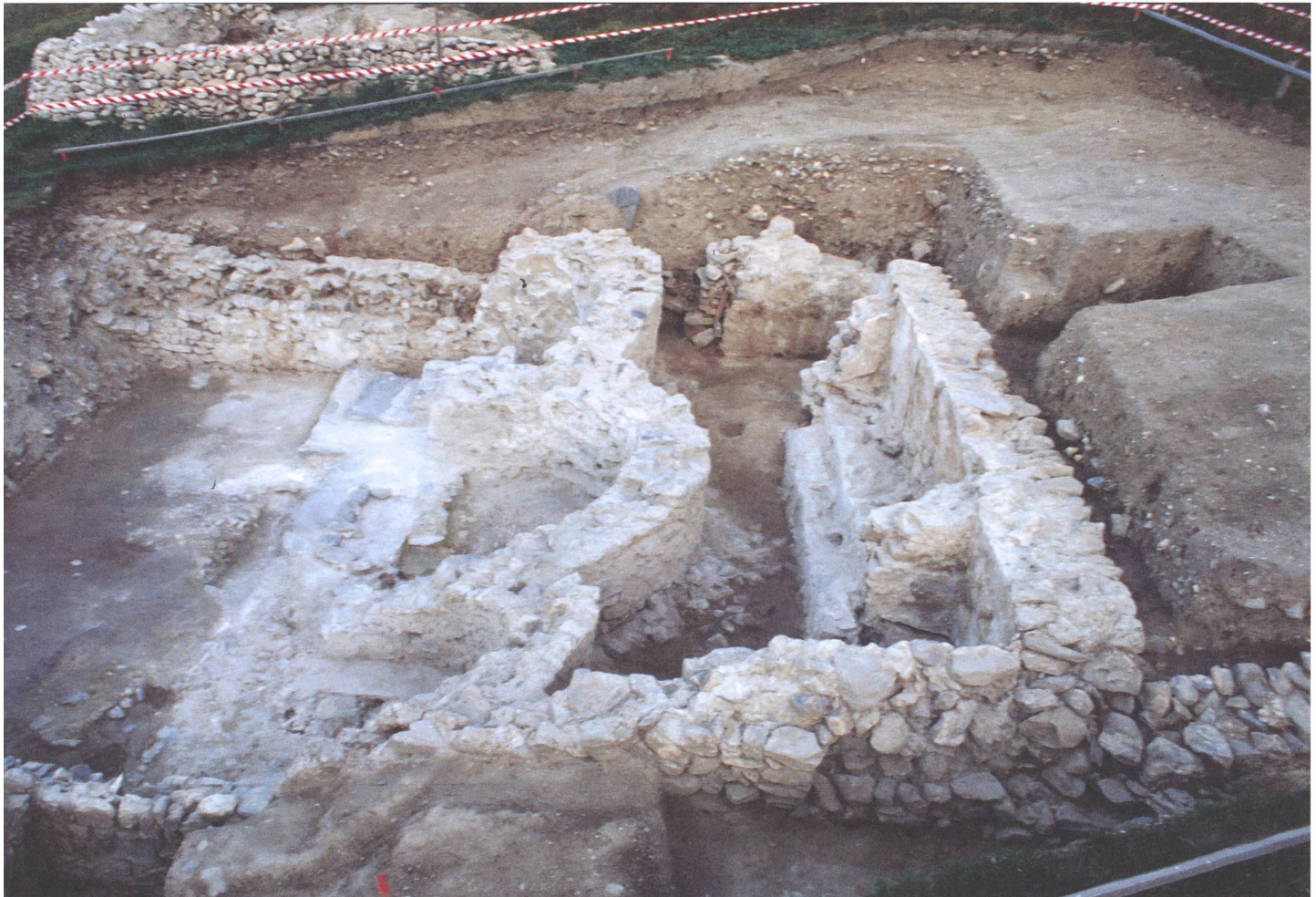
Abb. 5: Tomils, Sogn Murezi. 1995 werden die Baureste erstmals grossflächig freigelegt. Blick nach Norden.

ten nicht weitergeführt, weil er schwer erkrankt war und im Dezember desselben Jahres verstarb. Allerdings wurden unter der Leitung von Jürg Leckebusch, Prospektion Kantonsarchäologie Zürich, physikalische Georadaruntersuchungen vorgenommen, die gezeigt haben, dass mit einer deutlich grösseren Ausdehnung der Baureste unter Boden gerechnet werden muss als anfänglich angenommen. 5