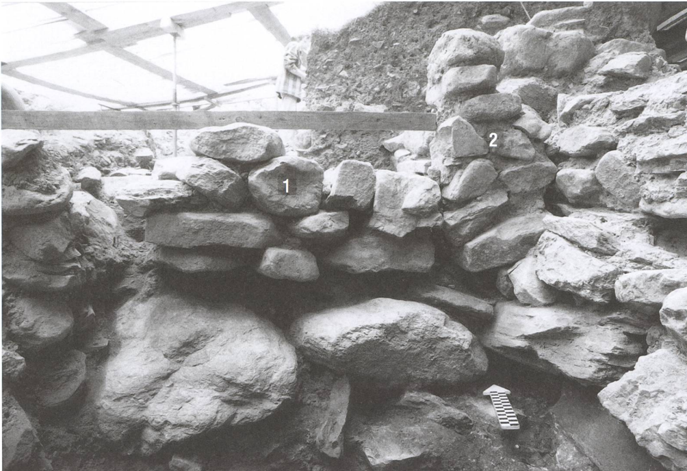
Abb. 331: Tomils, Sogn Murezi. Westannex. Raum H. 1 Trockenmauerwerk (538), 2 östliches Gewände des ehemaligen Einganges (807). Blick nach Norden.