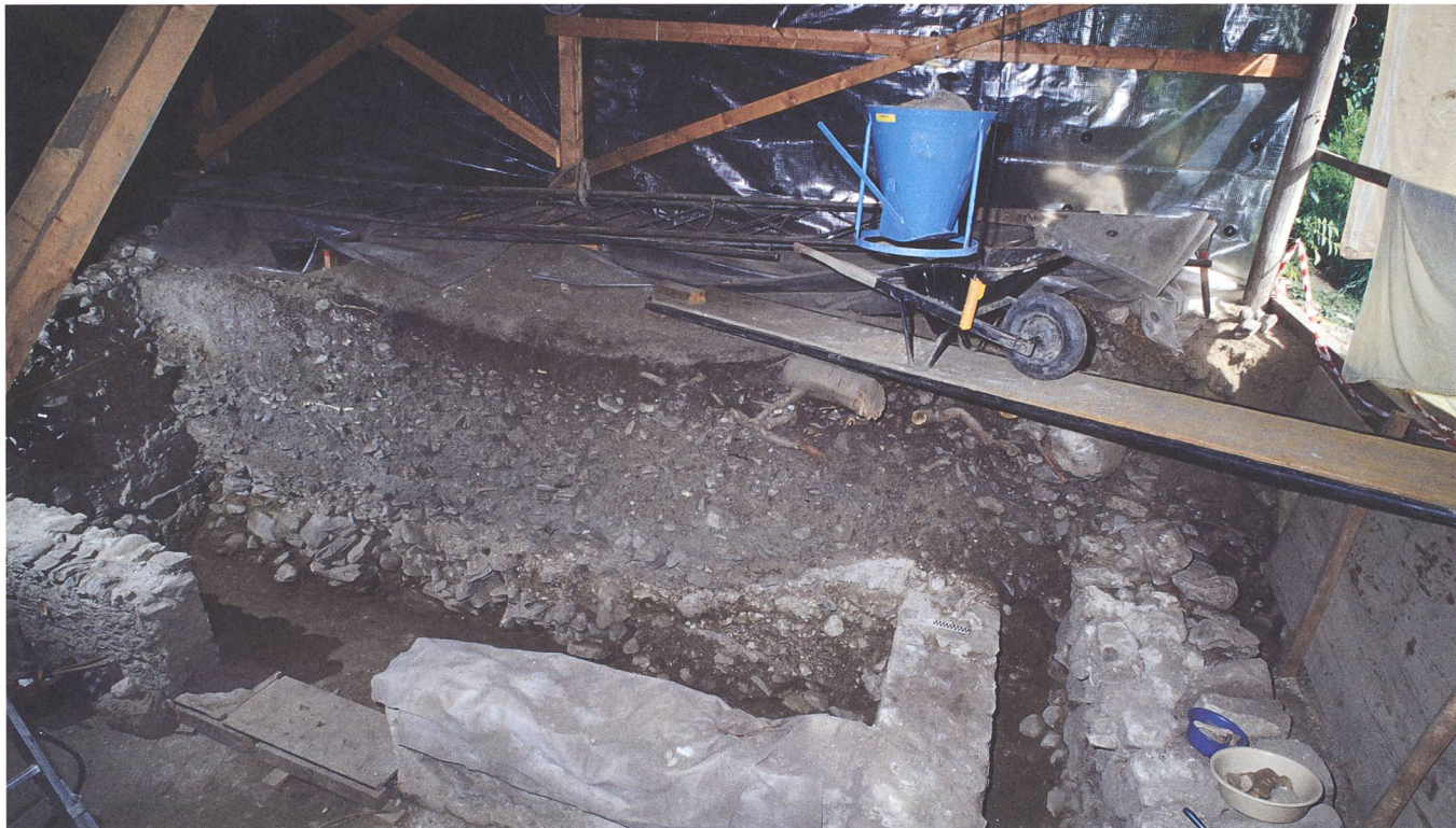
Abb. 334: Tomils, Sogn Murezi. Der mit Abbruchschutt (11) verfüllte Südannex E. Blick nach Nordosten.