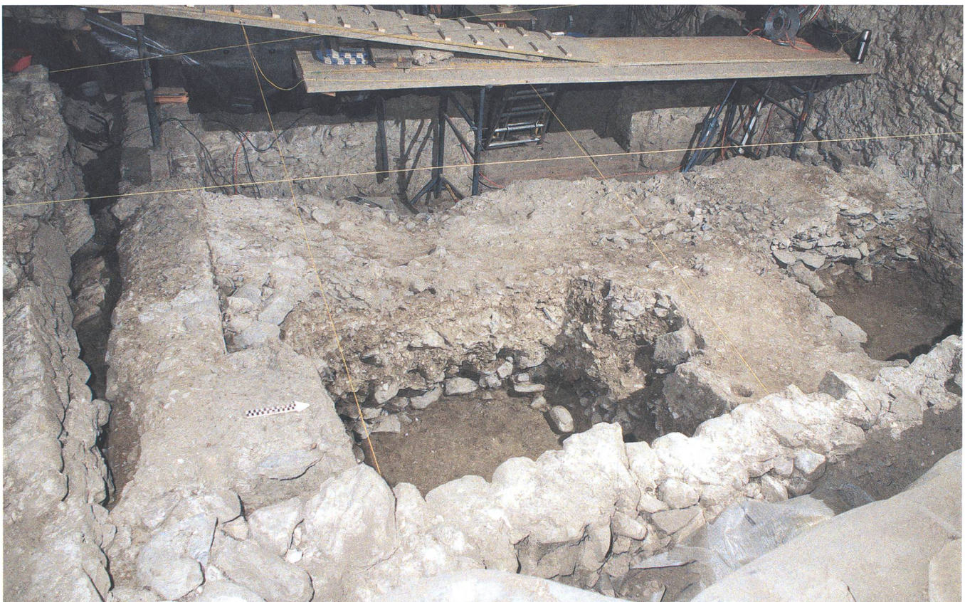
Abb. 333: Tomils, Sogn Murezi. Der mit Abbruchschutt (11) verfüllte Südannex E. Blick nach Nordwesten.

Im einstigen Südannex konnte im unteren Teil des Abbruchschuttpakets (11) eine Grube dokumentiert werden, die von den Bauleuten bei den Abbrucharbeiten ausgehoben worden war. In ihr lagen Tierknochen, bei denen es sich um Speisereste handelt Abb. 335 . 274 Rund 98% der Tierknochen stammen vom selben Ferkel. Ob es sich