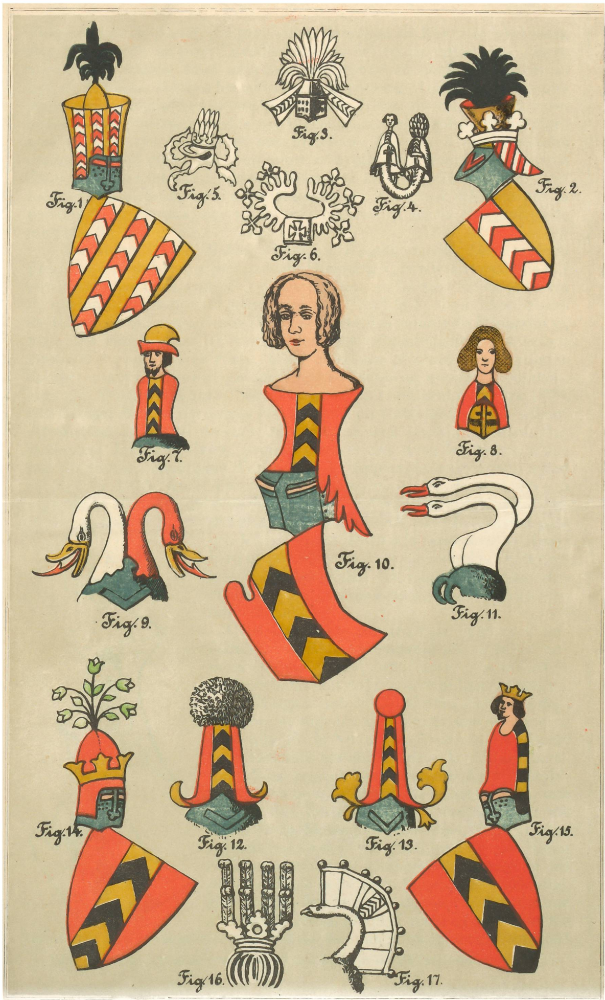
ARCHIVES HÉRALDIQUES SUISSES. N o . 25. Les CIMIERS de la MAISON de NEUCHÂTEL, par J. GRELLET.