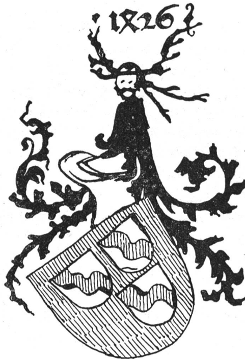
Fig. 3. Wappen des Johannes zum Bach, 1426, in einem Manuskripte der Luzerner Stadtbibliothek.

Merkwürdigerweise finden sich nicht viele Künstlerwappen, bei denen eine der geläufigsten und gerade zur Verbindung der Abzeichen von Stand und Individuum