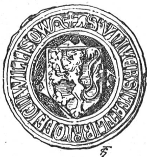
S. des Amtes Willisau 1400.

Das freie Amt Willisau führte in den Jahren 1400-1430 ein eigenes Rundsiegel, welches den wachsenden roten Löwen im goldenen Felde zeigt. Um dieses in einem Spitzsilde stehende Wappenbild zieht sich die Inschrift: S . VNIVERSIT . LIBRI . OFFICITE . DE . WILLISOW. Nach der Erwerbung des freien Amtes und der damit vereinigten Grafschaft Willisau durch die Stadt Luzern verlor das freie Amt bald das Siegelrecht; der Grafschaft blieb dagegen noch das Pannerrecht.