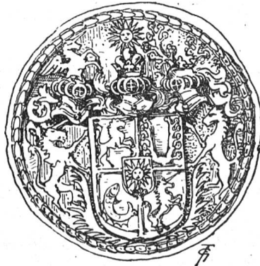
S. der Herren von Sonnenberg.

Die Gemeinde Fischbach führt 1730 einen gekrümmten, einem Regenwurm ähnlichen Fisch im Wappen (Fig. 7); 1798 einen im Bach schwimmenden Fisch, unter dem die Buchstaben F B stehen. Der Twingherr von Fischbach dagegen führt im XVII. Jahrhundert als Herr zu Casteln, Ballwyl und Fischbach im quadrierten Schilde in Feld 1 und 4 das Wappen von Ballwyl, im zweiten Feld das Wappen von Casteln, im dritten Fischbach. Im Herzschilde das Familien-Wappen der Sonnenberg. Der Fisch erscheint hier in gebogener Stellung.