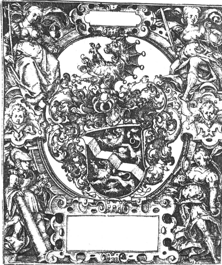
Ex-libris de Diesbach