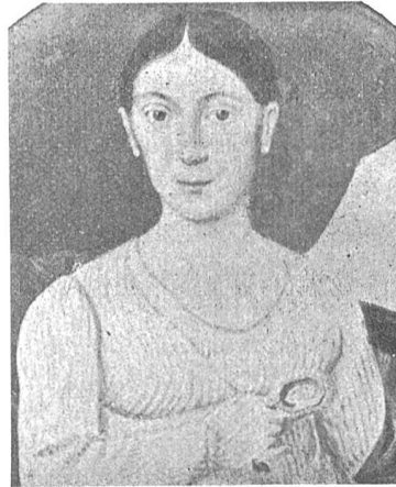
Fig. 65 (voir p. 111) MARGHERITA PEDROTTI 1787—1859

ALBERTO ANGELO ENRICO TURCHI né le 28 mars 1862 et mort le 11 septembre 1884.