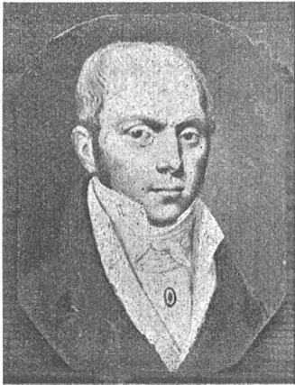
Fig. 64 (voir p. 111) ANGELO FORTUNATO PROTASO TREZZINI 1779—1833