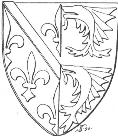
Relief auf einem Backstein in Montbrison. Fig. 19