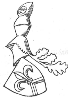
Steinrelief an einem Pfeiler der St. Peterskirche zu Basel. Fig. 20

Festschrift zum vierhundertsten Jahrestag des ewigen Bundes zwischen Basel und den Eidgenossen. 13. Juli 1901.