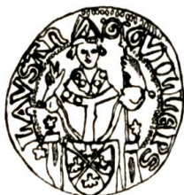
fig. 24 Demi Gros, ou 6 deniers (avers)