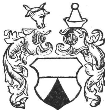
Fig. 35 Wappen der Herren von Wolen.

durch Dekret vom 23. X. 1823 der Hof Harzrüti zugeteilt, durch Dekret vom 29. X. 1912 aber die politische und ortsbürgerliche Vereinigung mit der Gemeinde Anglikon (1263 Anglincon, im Habsb. Urbar zum A Villmergen gehörig) verfügt, die bisher im Siegel ein Hexagramm mit einem Stern im Sechseck geführt hatte. Anglikon gehört zur Pf Villmergen (s. dort).