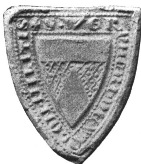
Fig. 34 Siegel des Ritters Wernher II. von Wolen 1313 II. 5.