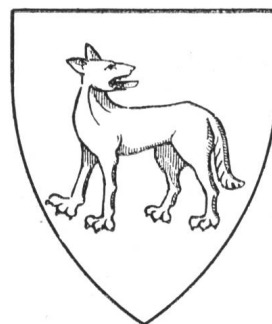
Fig. 217 Wölflinswil (Vorschlag).

Wölflinswil (1288 Wile, 1444 Wölfleswil, 1488 Wolfswiler; im Habsb. Urbar — Wulfswille — zum A Säckingen gehörig, dann zum A Homberg; 1441 MK, D Frickgau, B Basel) führt kein Wappen; ein redendes — roter Wolf in gelb — wäre zu empfehlen.