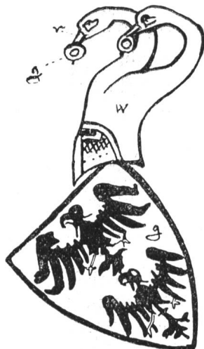
Fig. 216 Wappen der Grafen von Homberg.