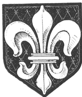
Fig. 51 Armoiries de St-Prex.

St-Prex est un ancien petit bourg fortifié qui appartenait au Chapitre de Lausanne. Il est situé sur un promontoire du lac Léman. Il compte actuellement 700 habitants et fait partie du district de Morges.