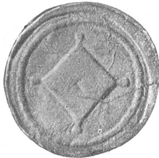
Fig. 23 Siegel der Landschaft Küsnach. 1732.