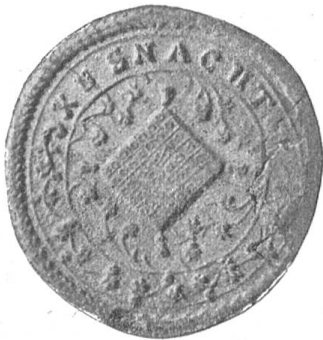
Fig. 22 Gemeindesiegel von Küsnach 1712.

Von dieser Zeit an kommt auch das Gemeindesigill, das Symbol der politischen Selbständigkeit, wieder zur Anwendung.