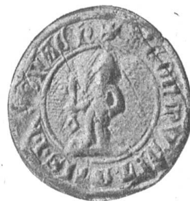
Fig. 21 Gemeindesiegel von Küssnach. 1378.

Erst den 23. Weinmonat 1712 wird der Landschaft Küssnach „weilen mit der Zeit die Privilegien und Fryheiten vnserer lieben Angehörigen merklicher Eintrag und Abbruch beschechen, deret wegen sie sich von Zeit zu Zeit beschwerdt das vns vnd so vil empfindlicher vnd bedurlicher gefallen, weilen vns hiedurch