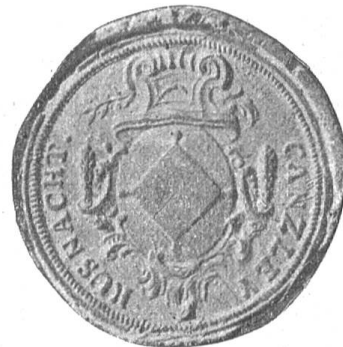
Fig. 24 Siegel der Kanzlei Küsnach 1786.

Es zeigt uns aber nicht mehr das alte Bild. Der Stempel des 14. Jahrhunderts ist selbstverständlich verloren gegangen und der Kirchenpatron St. Peter als Gemeindeemblem vergessen. An seine Stelle tritt nun die Wappenfigur der ausgestorbenen Edlen von Küsnach, das Kissen. Dabei wird dasselbe aber nicht, wie wir es in den Siegeln der Herren Eppo und Hartman finden, auf die Seite, sondern auf einen Zopf gestellt (Fig. 22). Im Verlauf des 18. und 19. Jahrhunderts wurden mindestens ein halbes Dutzend Stempel mit dieser Wappenform, bessere und schlechtere, angeschafft (Fig. 23, 24).