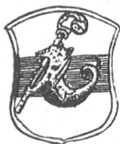
Fig. 28 Armoiries de l'Ajoie d'après un armorial du XVIII e siècle.

Il existe peu d'anciens documents représentant ces armoiries. Nous les reproduisons ici d'après un armorial manuscrit du XVIII e siècle des archives de Delémont (fig. 28).