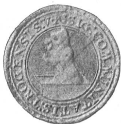
Fig. 102 Siegel von Trogen.

Der allgemein bekannte Trogener Kalender bringt das Gemeindewappen etliche Jahre hindurch auf seinem Titelblatt; das erste Mal beim Jahrgang 1769.