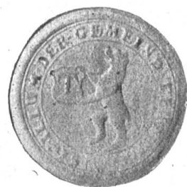
Fig. 97 Siegel von Teufen.

An den beiden Bündnisbriefen der Stadt St. Gallen mit Appenzell vom 17. Januar 1401 hängt kein Siegel von Teufen. Letzteres hat sich wie Gais und Urnäsch unter das Siegel von Appenzell gebunden. Erst Ende des 16. Jahrhunderts oder anfangs des folgenden scheint ein Bedürfnis nach einem Gemeindesiegel empfunden worden zu sein. Solches nun ist ein Rundsiegel mit der Umschrift: „Sigillum der Gemeind Teufen“. Innert dieser wird ein Schild im Renaissancestil von einem aufrechtstehenden Bären mit den Vordertatzen hochgehalten. Der Buchstabe T allein ist es, was diesen Schild schmückt; spätere Abbildungen zeigen diesen schwarz auf blauem Grunde. Da nach dem heraldischen Gesetze schwarz auf blau als Farben niemals aufeinander vorkommen sollen, muss da eines der zwei sogenannten Metalle, Gold oder Silber, in Betracht kommen. Aus bestimmten Gründen wurde Gold vorgezogen. Wenn nun das Wappen der Gemeinde Teufen in der obern Schild-