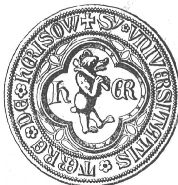
Fig. 94 Siegel von Herisau.

Herisau leitet seinen Namen von der Au eines Herin ab. Es tritt 837 als Herinisauva in die Geschichte ein. Der Kirche wird schon 907 gedacht; sie ist somit die älteste im Appenzellerlande. Über Herisau als einer Vogtei, setzten die Edeln von Rorschach ihren Ammann. In den Kriegen der Abtei St. Gallen wurde Herisau zum wiederholten Male ein Opfer der Flammen, so auch 1403. Durch das Bündnis vom 17. Januar 1401 traten die Herisauer in nähere Verbindung mit den Appenzellern, wurden aber vom Abte wieder davon abwendig gemacht. Herisau hat sich aber nachher um so inniger wieder Appenzell angeschlossen. 1529 fand die Reformation ihren Eingang in Herisau; seit der Landteilung 1597 ist Herisau neben Trogen ein Hauptort.