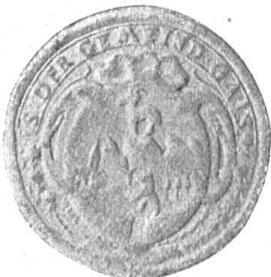
Fig. 98 Siegel von Gais.