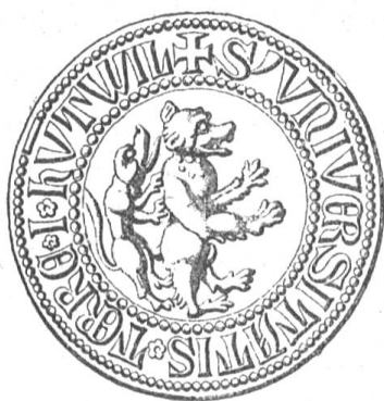
Fig. 91 Siegel von Hundwil.

die ersten ausserordentlichen Landsgemeinden diesbezüglich zusammen und erlangte dadurch zu ihrer Abhaltung ein bleibendes Vorrecht. Die Rhode Hundwil war in die Oberrhode und in die Unterrhode abgeteilt, von denen letztere seit 1749 die selbständige Gemeinde Stein bildet. Stechlenegg, die spätere innerrhodische Halbrhode, zählte bis zur Landteilung 1597 zur Hundwiler Oberrhode.