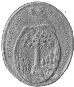
Fig. 104 Siegel von Walzenhausen.

Das Gemeindesiegel, das etwa in den Jahren 1803—1815 gestochen wurde, ist ein hübsches Ovalsiegel von recht scharfer und deutlicher Ausführung. Es enthält den Landbären als Schildhalter; dieser hält einen Ovalschild, der das eine ganze Geschichte erzählende Wappen bedeuten soll. Von den Schildrändern her neigen sich gegen die Mitte je eine Rebhalde und ein mit Tannen bewachsener Hang, die wohl die obgenannten zwei Teile des ehemaligen Hofes „Waltzenhusen“ zu bedeuten haben, denn gleich unten am Tannwald ist auch der Hof in Form eines einfachen Hauses angegeben. Nebenbei gesagt, dieser Hof ist auch das Wappen-