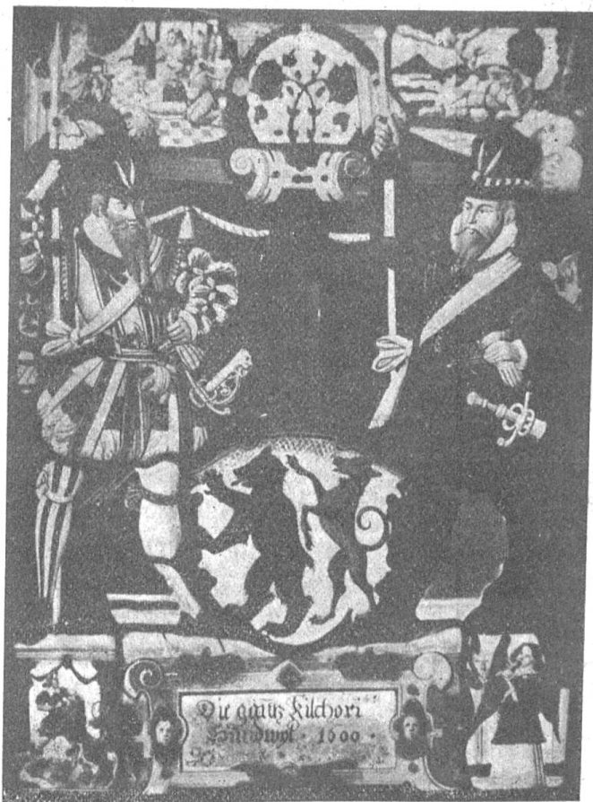
Fig. 93 Wappenscheibe mit dem Wappen Hundwil im Gemeinderatszimmer in Hundwil.

Bis auf 1755 herab lassen sich weiter keine Spuren von einem Gemeindesiegel nachweisen und erst in genanntem Jahre entsteht wieder ein solches. Auf die Frage, wer denn früher gesiegelt habe, lässt sich eine Antwort geben, die so ziemlich alle Gemeinden angeht. In Ermangelung eines eigenen Insiegels wurde jeweils das Landessiegel, das Privatsiegel des jeweiligen