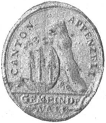
Fig. 103 Siegel von Wald.

Wald. Das Wappen dieser Gemeinde ist: in schwarz über rotem Schildfuss drei grüne, weißstämmige Tannen mit roten Zapfen (Vorschlag).