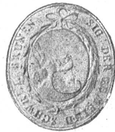
Fig. 96 Siegel von Schwellbrunn.

Mit dem Zehnten von „Schwellbrunn“ belehnt der Abt von St. Gallen unter anderm seinen Meier Ulrich Küchenmeister zu Hundwil am 2. Juni 1268. Später wird Schwellbrunn zu Herisau gerechnet bis 1648; es gründet sich eine eigene Gemeinde. 1794 schaffte sich diese ein eigenes Siegel an. Die Bedeutung des Siegelbildes tritt klar zutage durch den „schwellenden Brunnen“, der aus dem Felsen quillt.