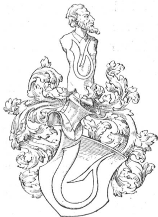
Fig. 24 (Zchg. Roschet)

Q: Familiengeschichte der Petri, Nürnberg 1913.