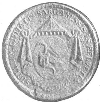
Fig. 100 Stadtsiegel aus dem Ende des 18. Jahrhunderts.

Beweis. Die Ryffsche Wappenhandschrift des 16. Jahrhunderts (Circkel der Eidgenoschaft) bringt auch die Farbengebung des Wappens (Fig. 99). Das rote Beschläge ist deshalb sehr beachtenswert, weil anscheinend nur der hohe Adel solche Schildeinfassung führte. Wir erinnern an die Wappen der Herzoge von Burgund, der französischen Grafen von Dreux, der Grafen von Nevers, der Grafen von Alençon, der Grafen von Châtelleraud, der Freiherren von Arcis-sur-Aube, der Freiherren von Trasnignies und anderer des hohen Adels.