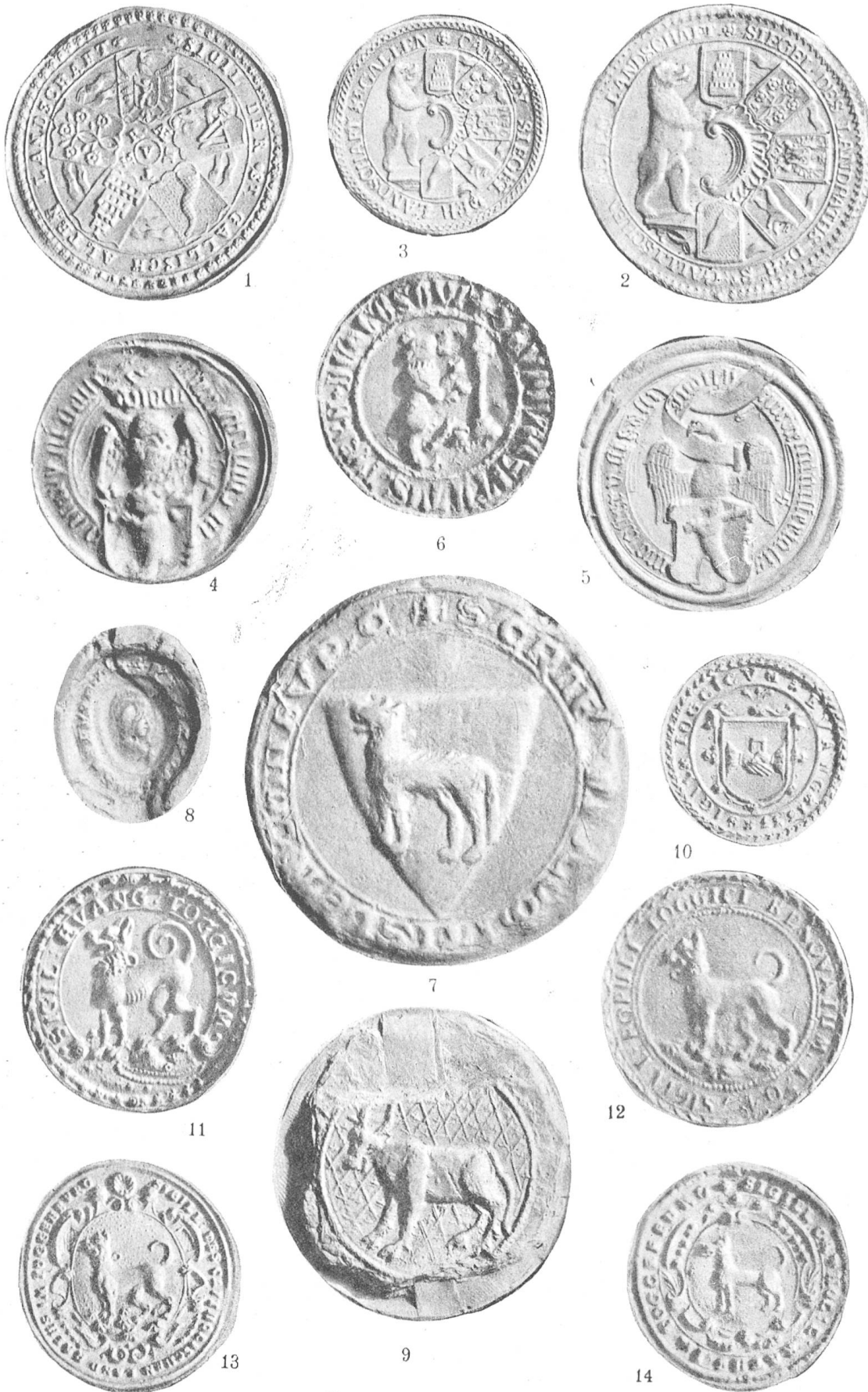
Siegel der St. Gallischen Unterthannenländer