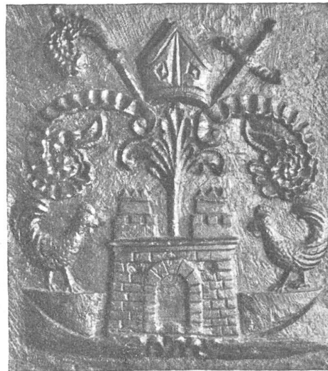
Fig. 123 Wappen Abt Sozzi auf einem Steinofen in Truns.

begraben wurde. Als Abt hat er es verstanden, würdig aufzutreten, hat deshalb auch mehrere Wappen hinterlassen, ja er wurde sogar in Kupfer gestochen. Seine drei Abtsiegel zeigen alle einen gevierteten Schild mit Kloster- und Familienwappen (Fig. 122), eines zeigt überdies auf dem Herzschild den hl. Georg von Jörgenburg. Die Familie führte früher in Silber ein bezinntes Tor mit zwei Vögeln auf den Zinnen und hinter dem Tor einen Baum. Ueberdies breitete im Schildhaupt ein schwarzer Adler seine Fittiche auf goldenem Grunde aus. Unser Abt liess in seinem Schild auf Silbergrund ein Zinnentor mit einem Baum darauf und je ein Hahn auf jeder Seite anbringen. Etwas frei, fast ornamental gehalten, ist ein Wappen Sozzis auf einem Steinofen des Trunserhofes (Fig. 123). Das Wappenbild steht ohne Umrahmung und Inful, Pedum und Schwert ruhen nur auf einem Rokocoschnörkel.