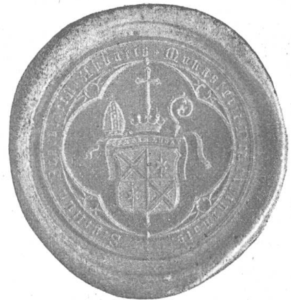
Fig. 129 Siegel des Abtes Benedict II. Prevost.

28. Benedict Prevost 1888—1916. Nach Abt Birkers Wegzug blieb die Abtei wieder bis 1888 verwaist. Unterdessen war aber neues Leben in das alte Stift eingezogen. Abt Benedict hatte 1880 als Prior und von 1888 an als Abt die Erneuerung geleitet. Er wurde am 12. März 1848 in Münster, Kt. Graubünden, geboren, trat 1870 ins Stift Gries und wurde 1871 Priester. Ihm war es vergönnt, sein 25-jähriges Abtsjubiläum zu feiern, und auch die 13. Centarfeier der Gründung des Stiftes, bei der das Oberländer-Volk seine Anhänglichkeit an das Stift glänzend bewies, fällt noch in seine Regierungszeit. Sein Wappen zeigt das Disentiser Kreuz geviert mit dem Wappen Prevost, einem goldenen Stern auf blau und rot gespaltenem Feld. Auch der Wappenspruch semper lucet stammt vom Wappen Prevost. (Fig. 129).