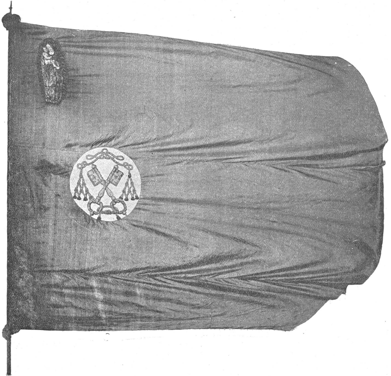
Fig. 148 Stadtpanner von Mellingen im Landesmuseum in Zürich.