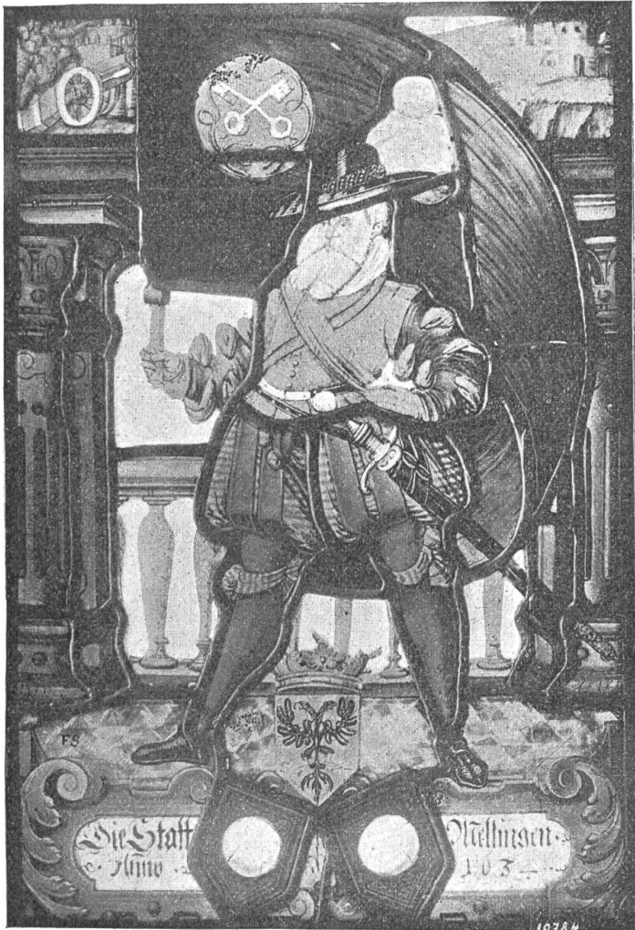
Fig. 151 Wappenscheibe von Mellingen 1634 in der Pfarrkirche in Mellingen.

die auf dem Halbmonde stehende Madonna mit Kind und Szepter, auf der andern Johannes den Täufer. Er hält in der einen Hand einen goldenen Kreuzstab, auf dem andern Arm ein Buch, auf welchem das Lamm Gottes mit der Kreuzfahne ruht. Diese künstlerisch unbedeutenden Figuren sind direkt auf den Taffet gemalt. 1