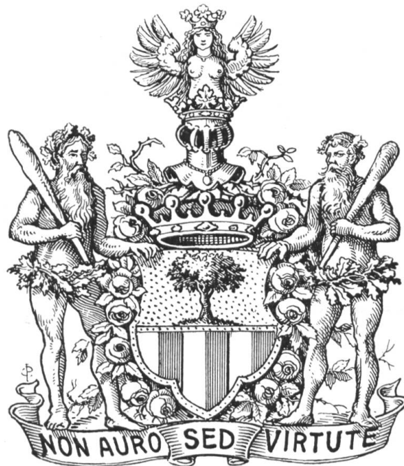
Fig. 188. Wappen der Salis-Maienfeld in Holland.