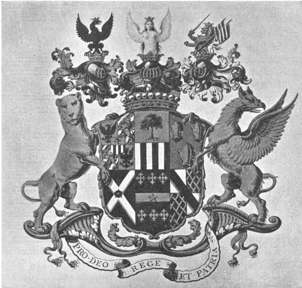
Fig. 187. Englischs Wappen von Salis-Bondo von 1809.