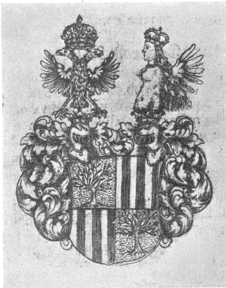
Fig. 171. Gräfl. Wappen von Salis. 1694.

Wappenvermehrung: Schild geviertet wie bei Rudolf (1582) und Hans Wolf (1632); zwei Helme: Helmzier rechts schwarzer Doppeladler gekrönt mit der österreichischen Kaiserkrone („ acquila nigra biceps utroque capite corona Imperiali insignita “), Helmdecken schwarz-gelb; links die Salis'sche Jungfrau,