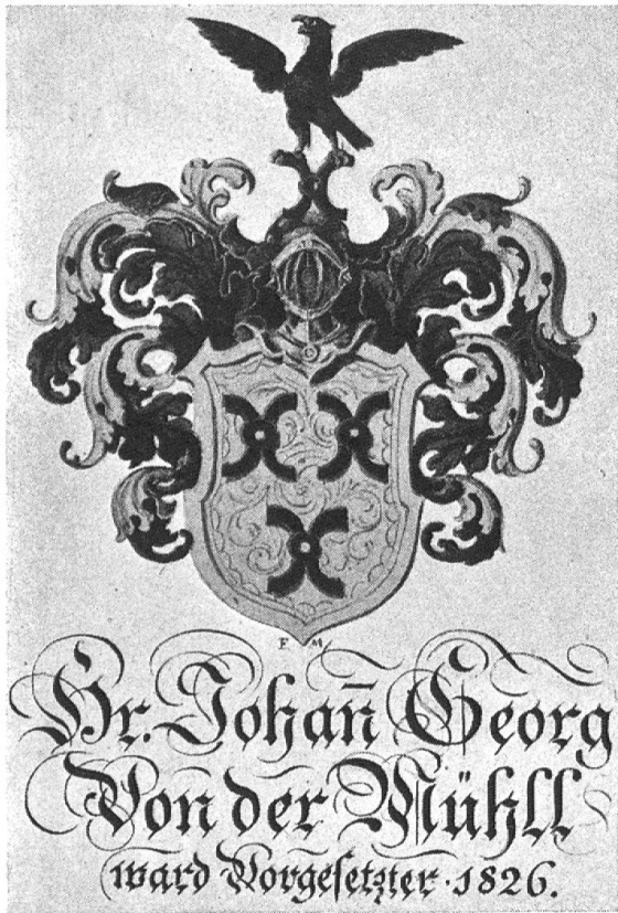
Fig. 5. Aus dem Wappenbuch E. E. Zunft zu Hausgenossen.

als Zunftschriftreiber E. E. Zunft zum Schlüssel in gelbem Feld drei schwarze Mühleisen, als Helmzier einen auffliegenden schwarzen Vogel und schwarz und gelbe Helmdecken. Adolf VonderMühl endlich führt 1890 als Vorgesetzter E. E. Zunft zu Hausgenossen in gelbem Schild drei schwarze Mühleisen und auf dem Helm einen dunkeln auffliegenden Vogel, sowie rot und gelbe Helmdecken.