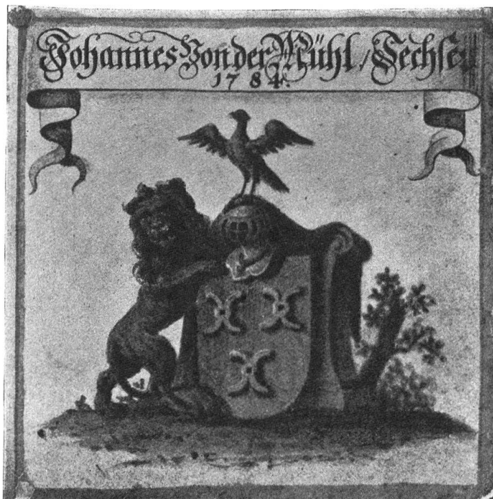
Fig. 3. Aus dem Wappenbuch E. E. Zunft zu Weinleuten.