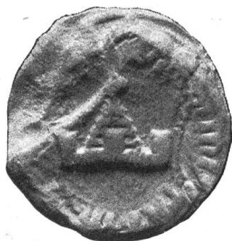
Fig. 24. Amtssiegel Berchtolds v. Malters, 1357.

In seinem Amtsstempel führte Vogt Berchtold, an Stelle seines angestammten Wappens, als Amtszeichen im freien Siegelfelde den aus Zinnen hervorragenden Helm seines Wohnturmes (Fig. 24): \text{S' B} \cdot \text{MINISTRI} \dots (1357, II. 27 StA Luzern, F. St. Urban 26). Siegel seines Sohnes des Vogtes Hermann fehlen, Johann v. Malters, Vogt von Wolhusen (Fig. 25). \text{S' JOH} \dots \text{DCI. VOGT DE WOL} \dots (1383, VIII, StA Luzern, Pfarrakten Escholzmatt) hatte aber bereits das väterliche Amtszeichen in seinen Wappenschild und den Amtsnamen als Familiennamen in die lateinische Siegellegende aufgenommen, obwohl er sich in der Urkunde noch ausdrücklich als „v. Malters“ bezeichnete. Unter diesem Namen „Vogt“ kam dieser Zweig nach Luzern; sein bedeutendster Vertreter war Heinrich