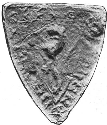
Fig. 21. Walther von Hochdorf 1231.

20. Zum Schlusse kommt hier das wenig bekannte älteste Siegel der Bürger-schaft von Luzern (☒ S · CIVIUM · LUCERNENSIVM · — Fig. 20) zur Darstellung. Es zeigt einen schräglinks gestellten Balken, belegt mit 3 kreuzförmigen Blumen oder Beschlägen. Der Ursprung dieses Bildes, das einem Privatwappen entnommen oder willkürlich gewählt sein kann, ist unbekannt. Entstanden ist das Siegel zur Zeit der Freiheitskämpfe Luzerns gegen die murbachische Grundherrschaft, in den Vierzigerjahren des XIII. Jahrhunderts. Seine älteste Verwendung dürfte an jenem undatierten Briefe einer Anzahl Nidwaldner Edler und Ammänner sein, in welchem sie der verbündeten Stadt Zürich u. a.: „Salutem et super inimicis victoriam triumphalem“ wünschten und, weil sie kein eigenes