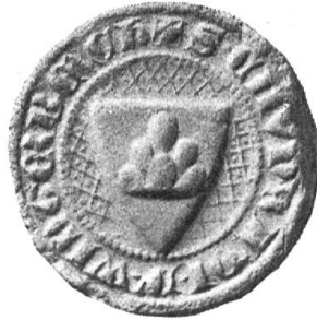
Fig. 14. Conrad v. Winterberg Ritter 1313.