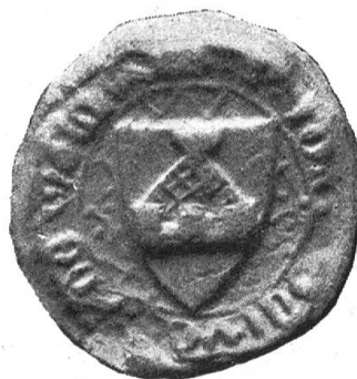
Fig. 25. Joh. von Malters, 1383.

Vogt, Stiftspropst zu St. Leodegar, 1490—1491 Rektor der Universität Basel, deren Matrikel zum Jahre 1490 eine prächtige Darstellung seines Wappens enthält (Her. Arch. 1916, Beilage B 6). Das von ihm angelegte Urbar des Stifts im Hof, von ca. 1500, zeigt ebenfalls das Wappen : in blau, aus weissen Zinnen hervorragendes rotes Turmdach mit Kugelstange. Es ist auch abwechselnd mit demjenigen des Stifts und von Murbach (Variante) auf dem Lederdeckel des Urbars eingepresst.