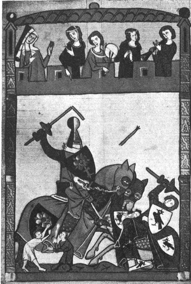
Fig. 18. Albrecht Marschall v. Rapperswil schlägt im Turniere einen Herrn von Ottenbach (Manesse'sche Liederhandschrift).

Wappen: in schwarz 3, 2, 1 gestellte weisse Sechsberge (ZWR No. 497) (Fig. 17) und Benefaktorentafel von Wettingen, Ritter Chunrad führte 1313 nur einen Sechsberg. Kleinod: schw. hohe Spitzmütze seitwärts und oben mit einer w. Kugel besteckt, Siebmacher 1655 Bd. III 139 belegt die Mütze mit dem Schildbild.