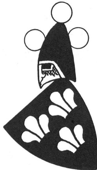
Fig. 17. Winterberg (ZWR).

Ritter Chunrad (1296—1313) erhielt 1313 für seine Dienste ein Haus in Luzern als österreichische Pfandschaft. Er und seine Brüder, die Ritter Albrecht III. (1316—1329) und Rudolf III. (1318—1335) spielten eine Rolle.