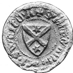
Fig. 22. Hermann Sweigmann 1330.