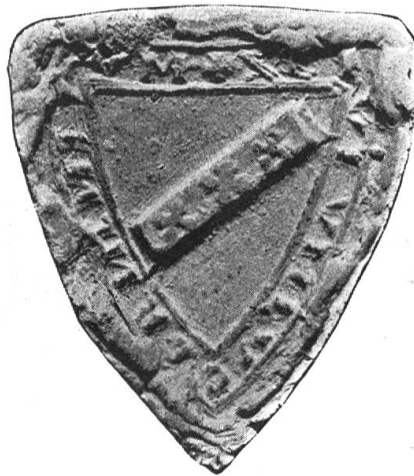
Fig. 20. Bürgererschaft von Luzern 1245.

19. Edelknechte von Wolhusen. Diese Ministerialen des gleichnamigen Dynastengeschlechtes scheinen um 1280 mit Ita Freiin von Wolhusen, Gräfin von Froburg, nach Kleinburgund gezogen zu sein, wo sie 1306 auftraten, und zwar in Solothurn und im Seeland. Sie sind bis in die Mitte des XV. Jahrhunderts nachweisbar. 1387—1393 war der rauflustige Bilgeri v. Wolhusen, Mitglied der Rittergesellschaft vom Fuchs und schwarzenbergischer Dienstmann, in Zürich in Prozesse verwickelt und bisweilen geächtet. 1393 lag er in Fehde mit der Stadt St. Gallen. Mit einem Stempel, der 1871 in Interlaken ausgegraben wurde, dann jedoch wieder verscholl, hatte der Edelknecht Johann 1361 den Verkauf einer Liegenschaft zu Guntzerlo bei Waltwil (Büren) an das Johanniterhaus Buchsee besiegelt (defekt). Nach 56jähriger Verschollenheit kam der hübsche Stempel kürzlich unter No. 4709 in den Besitz des Historischen Museum Bern. Die seit 1289 in Schaffhausen und ganz vereinzelt 1414 in Sitten bezeugten bürgerlichen Wolhusen, scheinen mit diesem Geschlechte nicht im Zusammenhang zu stehen.