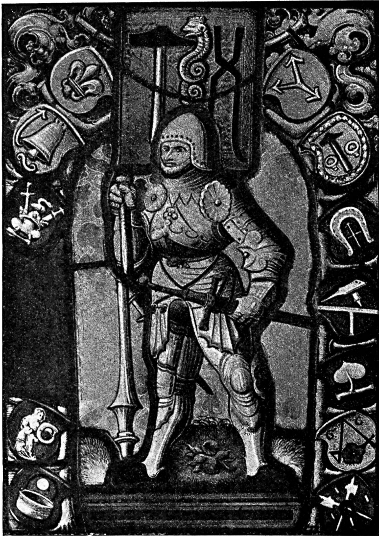
Fig. 79. Wappenscheibe der Schmiedenzunft von Zürich (Landesmuseum Zürich).

So fehle zum Beispiel in Basel, wo die Ärzte eine Zunft für sich haben, auch die Schlange im Schildbild der Schmiede (Fig. 85) 2) . Dieser Erläuterung steht nun die Tatsache gegenüber, dass das interessante Siegel eines Schmiedknechtenkönigs von Zürich vom Jahre 1412 (Fig. 83) 3) eine Schlange zeigt, die sich um eine Zange windet, in die sie beisst und dass weiter zwei Schilde eines Hufschmieds 4) aus dem Ende des fünfzehnten Jahrhunderts (Fig. 86) am Hause „zum schiefen Eck“ an der Greifengasse in Basel ebenfalls eine Schlange enthalten, trotzdem schwerlich