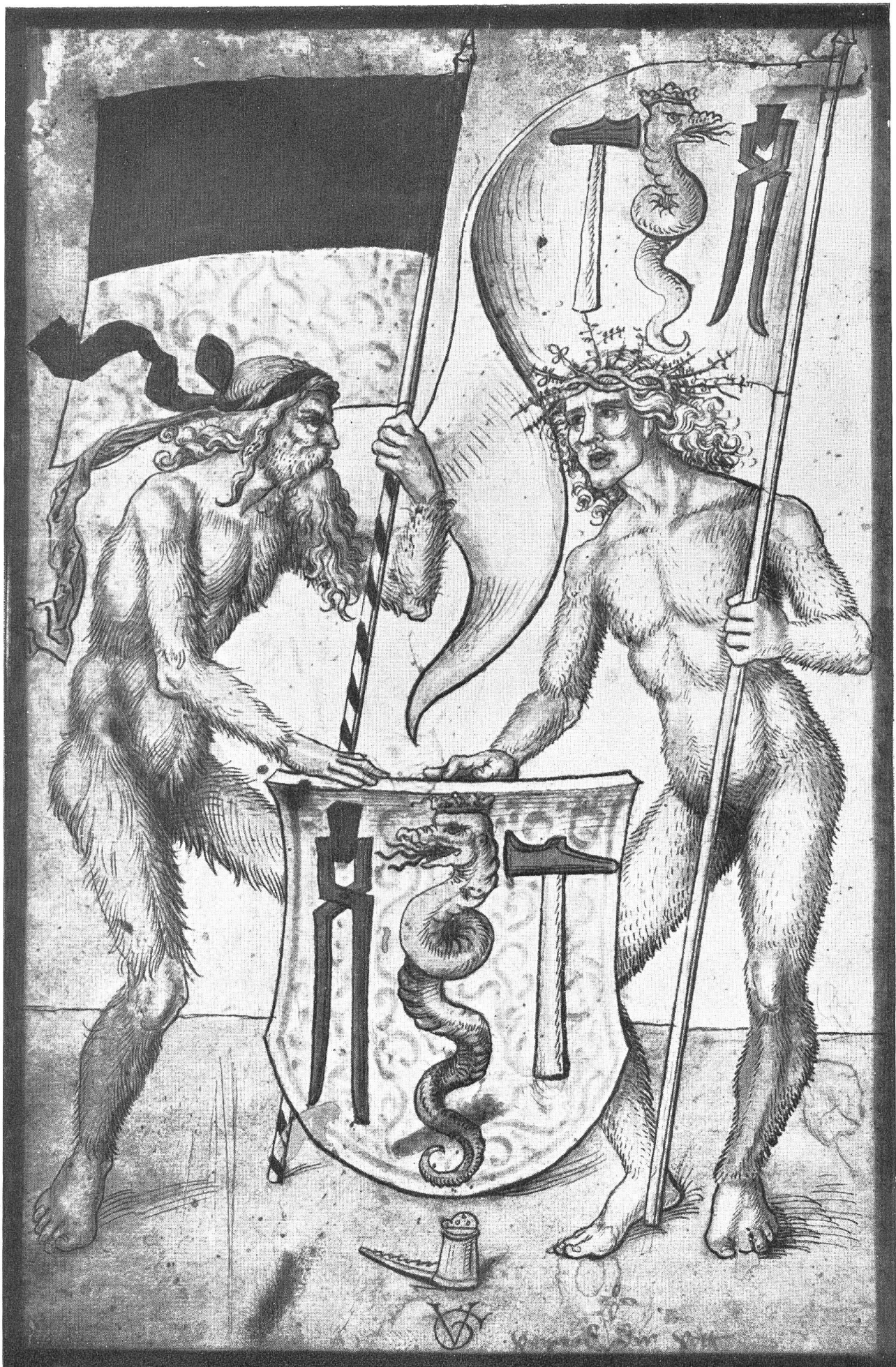
Wappen der Schmiedenzunft von Solothurn von Urs Graf (um 1510)