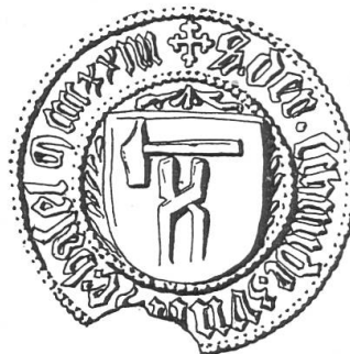
Fig. 85. Siegel der Schmiedenzunft von Basel, 1424.