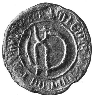
Fig. 83. Siegel eines Schmiedknechtenkönigs von Zürich, 1412.