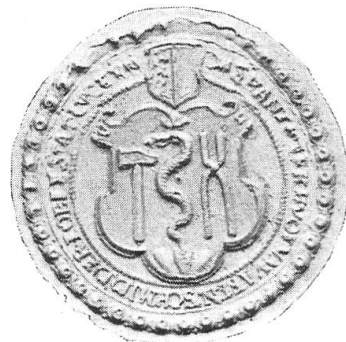
Fig. 82. Siegel der Schmiedenzunft von Luzern.