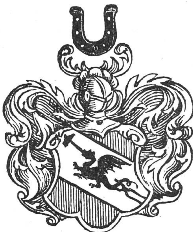
Fig. 81. Wappen der Schmiedenzunft von Strassburg.