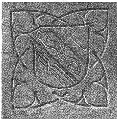
Fig. 84. Bodenflies mit Wappen der Schmiedenzunft von Rothenburg a. d. Tauber 6) .