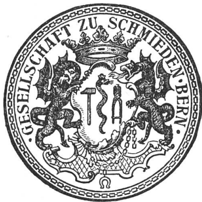
Fig. 80. Wappen der Schmiedenzunft von Bern.

meisten Schmiedezünfte tut (siehe Tafel VII) 5) . Wir glauben, es wagen zu dürfen, die Schlange im Wappen der Schmiede mit der Schlange Aspis zu identifizieren, von welcher es im Physiologus heisst: