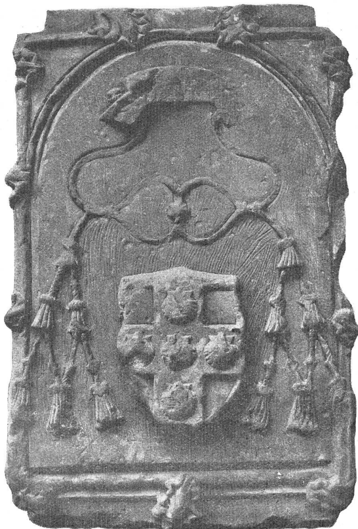
Fig. 111. Pierre tombale de Jean-Amé Bonivard à l'église abbatiale de Payerne.

Il reste encore à Payerne deux souvenirs du passage de Jean-Amé Bonivard dans cette ville. Le premier est un vitrail qui est conservé dans une fenêtre de la chapelle de Grailly dans l'abbatiale. Il porte bien les caractères d'un vitrail du commencement du XVI e siècle. Les armoiries de l'abbé, surmontées de la crosse,