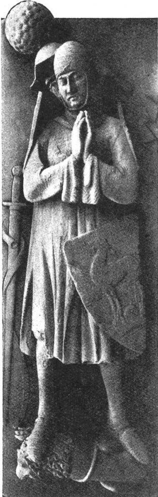
Fig. 37. Grabmal des Grafen Rudolf III. von Tierstein (Basler Münster).

so schlechten baulichen Zustande und auch so unkomfortabel, dass es kaum mehr den Anspruch einer standesgemässen gräflichen Behausung erheben konnte, besonders nicht einem Manne wie Graf Oswald, der die höchsten Ämter bekleidete, genügen mochte, war er doch Kaiserlicher Rat, sowie österreichischer und lothringischer Marschall, Landvogt und oberster Hauptmann im Elsass, Sundgau und Breisgau, und als solcher