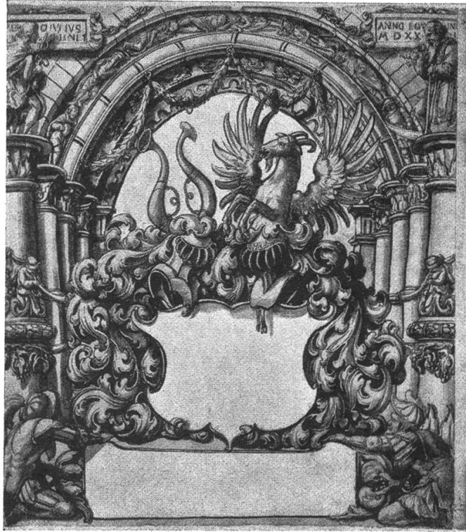
Fig. 39. Wappen der Frh. von Hewen. Scheibenriss von Hans Holbein d. J., dat. 1522 (Kunstsammlung Basel).