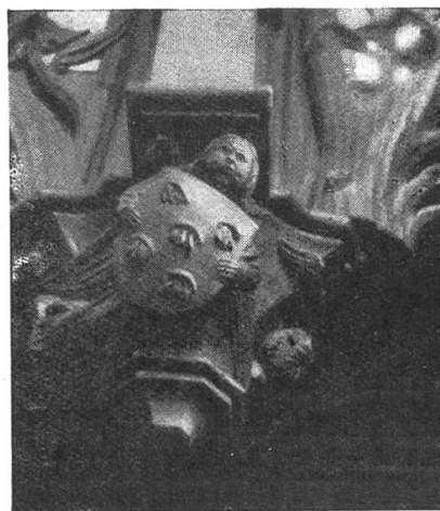
Fig. 44. Armes symboliques. Les cinq plaies du Christ.

L'examen minutieux de ces armoiries a permis aux archéologues d'élucider bien des problèmes dans l'étude des phases constructives de ces parties de la cathédrale. Là aussi nous voyons, combien l'étude des armoiries peut être utile à l'archéologue.