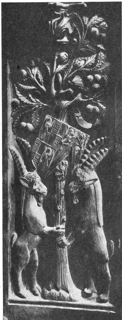
Fig. 43. Armoiries des parents de l'évêque Aymon de Montfalcon.

Il fit construire aussi la tribune de l'orgue et abattre le mur qui séparait la nef du narthex. Il installa la chapelle des martyrs thébéens et fit édifier le grand portail. Tous ces travaux furent marqués de son sceau, c'est à dire de ses armoiries.