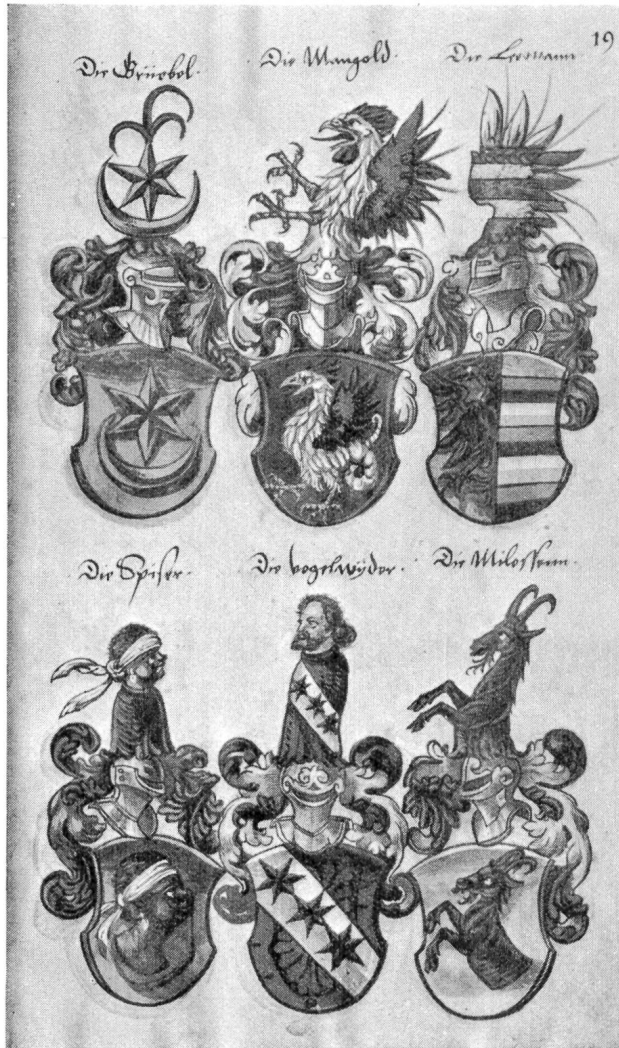
Fig. 12. Wappen St. Gallischer Geschlechter (Letzte Abteilung des Wappenbuches).

war. Zürcher und St. Galler Geschlechter sind ebenfalls in grösserer Zahl vertreten, öfters aber mit unrichtigen Farben blasoniert. Von Zürich seien beispielsweise genannt: Brechter, Escher, Haab, Holzhalb, Keller, Lavater, Rahn, Röist, Schmid, Schön, Schwarzmurer, Stigel, Walder, Wolfleibsch und Manesse, von St. Gallen: