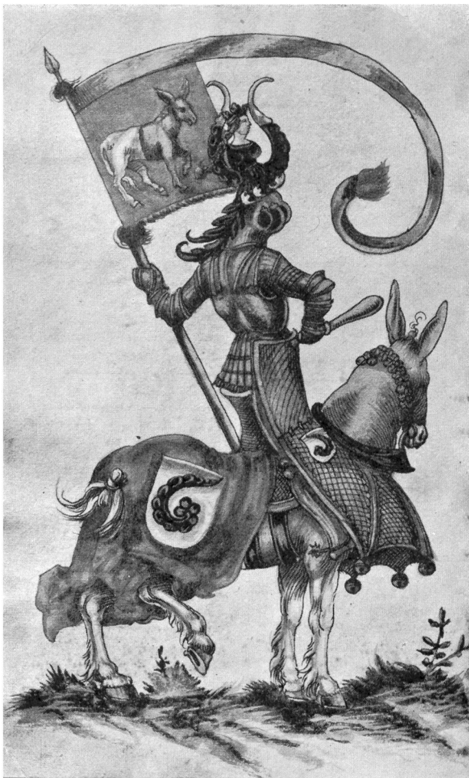
Fig. 10. Götz von Elzheim, Ritter und König der Turniergesellschaft im oberen Esel.

einen Blätterkranz im Haar. Die Pannerhälterin des niederen Esels in rotem Kleid und weisser Haube ist Holbeins Basler Frauentracht nachgebildet. Zwei lokale Rittergesellschaften beschliessen die Folge, mit je einem ganzseitigen Wappen und der Inschrift: Der Ritterschaft zum Mühlstein Wappen und der Ritterschaft zum Hohensteg Wappen, in schwarz ein weisser Mühlstein und in rot ein gelber hoher Steg, beide mit Doppelflügen als Zimier.