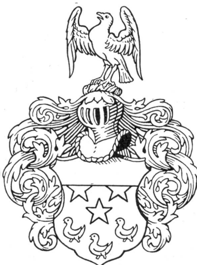
Fig. 26. Frémot.

l'Armorial du Canton de Fribourg. Les dessins des armoiries qui illustreront cet armorial ont été exécutés par M. Eugène Reichlen. Nous en donnons ici quelques spécimens.