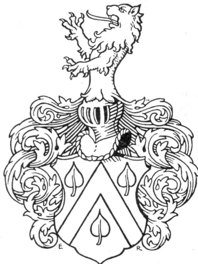
Fig. 25. Fracheboud.

Contribution à l'Armorial fribourgeois. M. Hubert de Vevey-L'Hardy travaille depuis plus d'une quinzaine d'années à l'élaboration d'un armorial du Canton de Fribourg. Il a étudié pour cela toutes les sources originales: les sceaux, les documents, les monuments et les armoriaux anciens. Pour chaque blason il a noté les sources les plus anciennes et les variantes. Afin que toutes les personnes qui s'intéressent à l'héraldique fribourgeoise puissent bénéficier le plus vite possible du résultat de ses recherches, M. de Vevey a eu l'excellente idée de publier son travail par tranches, comprenant chacune les noms de familles allant de A. à Z., dans les Annales fribourgeoises 1) , et sous le titre de Contribution à