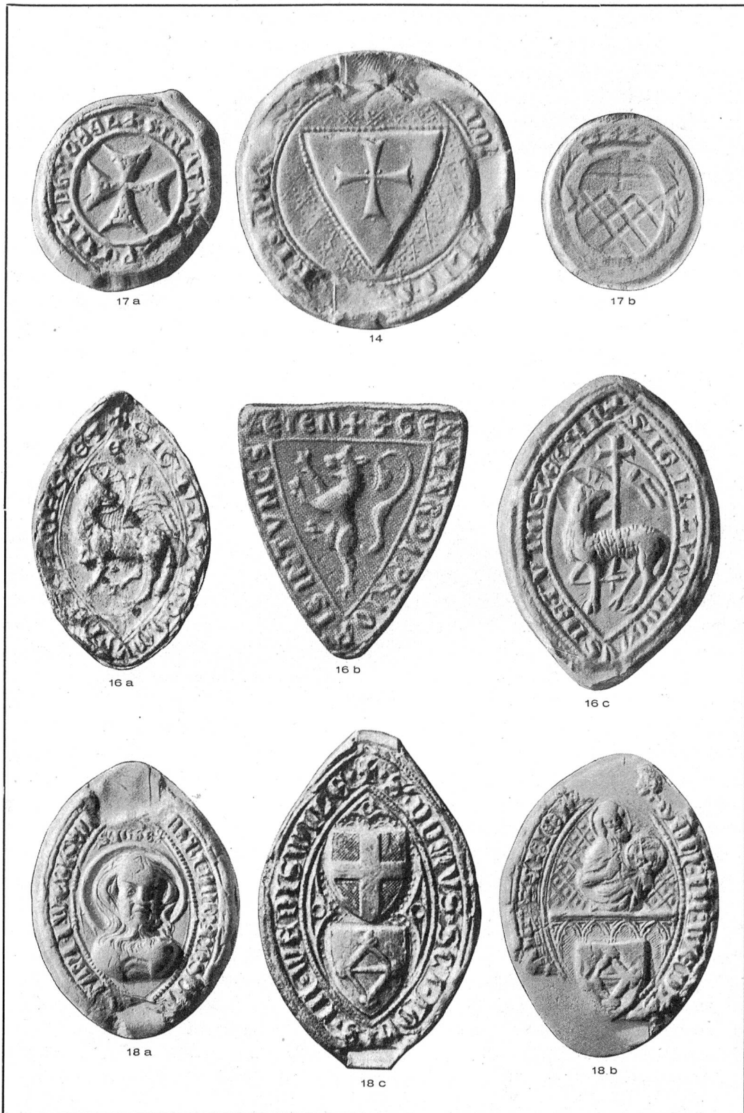
Rheinfelden 14 1277; Thunstetten 16a 1279, 16b 1291, 16c 1317; Tobel 17a 1277—1333, 17b 1711; Wädenswil 18a 1332, 18b 1335, 18c 1342.