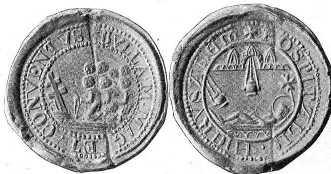
Fig. 128. Bleibulle des Grossmeisters und Convents des Souv. Malteser-Ordens. Heute noch in Verwendung.

Nachdem in den 30er Jahren des XIX. Jahrhunderts jede Hoffnung schwand, die einstige politisch-militärische Machtstellung des Ordens irgendwo wieder aufzurichten, schritt er 1854 zu einer Reform . Ausser der deutschen, italienischen und spanischen Zunge wurden alle aufgehoben und nur die Grosspriorate Italien und Österreich-Böhmen beibehalten. Da sich die Malteser nicht mehr militärisch