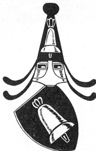
Fig. 135. Rekonstruiertes Vollwappen des Berner Ratsgeschlechtes.