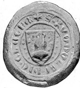
Fig. 130. Siegel des Rudolf Gloggner, der Bürger zu Zürich u. Konstanz, 1. März 1374. Leg.: „✠ Ruodolfi dic(tus) Glogner“