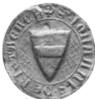
Nr. 1 Siegel von Nr. 4 des Textes (Johann)