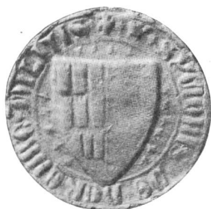
Nr. 1 Siegel von Nr. 4 des Textes (Symon)