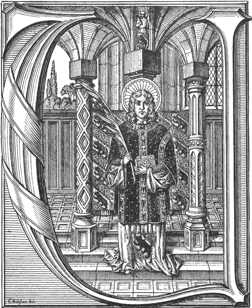
Fig. 42. Die Initiale V mit dem heiligen Vinzenz in einem Berner Antiphonar.