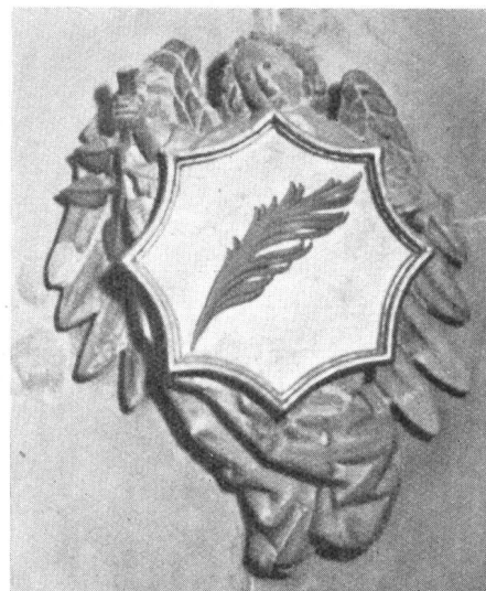
Fig. 41. Wappen des St. Vinzenzstiftes im Berner Münster.