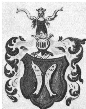
Fig. 15. Wappen des Grafen Richard von Mömpelgard.