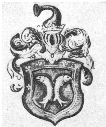
Fig. 14. Wappen der Grafen von Montfaucon.

Der hl. Bernhard, der an der Grundsteinlegung Lützels im Jahre 1223 persönlich teilgenommen haben soll, trägt die weisse Kukulle; vor ihm, stabgeschmückt, sein persönlicher Wappenschild, der in der Folge zum Ordenswappen der Zisterzienser wurde, hier in Weiss, statt in Schwarz, ein rot-weiss geschachter Schrägrechtsbalken. Ihm zur Seite Bischof Bertulf von Basel, aus dem Geschlechte der Grafen