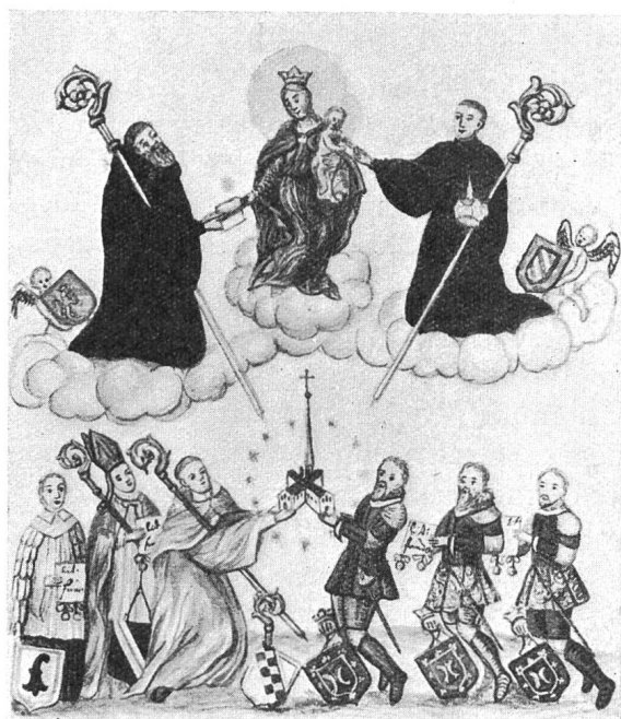
Fig. 13. Die Gründer von Lützel mit ihren Wappenschilden.

die Handmalerei aus Walch, Bd. I. pag. 131, welche nach der obigen Vorlage ausgeführt wurde und mit Ausnahme der fehlenden Putten und Engelsköpfe sowie des Wappens Abt Bernardins, die nämlichen Figuren und Wappen und in der nämlichen Anordnung wiedergibt (Fig. 13).