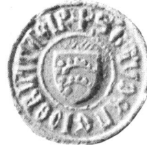
1. (Nr. 4: Andreas 1330.) 2. (Nr. 8a: Gaudenz 1376.) 3. (Nr. 8b: Gaudenz 1396.)