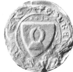
1. (Nr. 5: Simon 1335.) 2. (Nr. 7a: Johann I. 1335.) 3. (Nr. 7b: Johannes I. 1349.) 4. (Nr. 10: Albrecht 1369.)