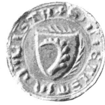
1. (Nr. 8: Bernhard 1351.) 2. (Nr. 9: Ulrich III. 1351.) 3. (Nr. 10: Rudolf 1351.) 4. (Nr. 11a: Liechtenstein 1351.)