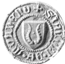
1. (Nr. 10: Jacob 1381.)