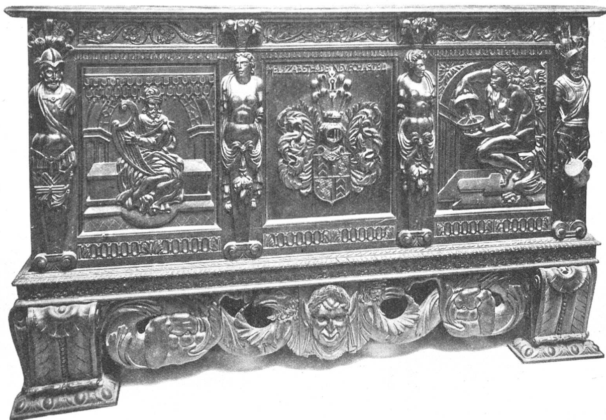
Fig. 42. Bahut aux armes d'Elisabeth de Neuchâtel.

Depuis la rédaction du début de ce travail j'ai eu la chance de retrouver quelques cachets et sceaux inconnus des descendants de Girard de Neuchâtel-Vaumarcus. Je les ai rassemblés ci-dessous. Ils n'apportent d'ailleurs rien de nouveau