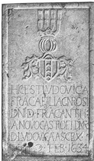
Fig. 39. Pierre tombale de Louise-Françoise de Neuchâtel.

sculpteur, sur la tombe de Louise-Françoise de Neuchâtel († 1634) (130) (fig. 39) 1) . Ce plumail est par contre particulièrement réussi sur le vitrail de