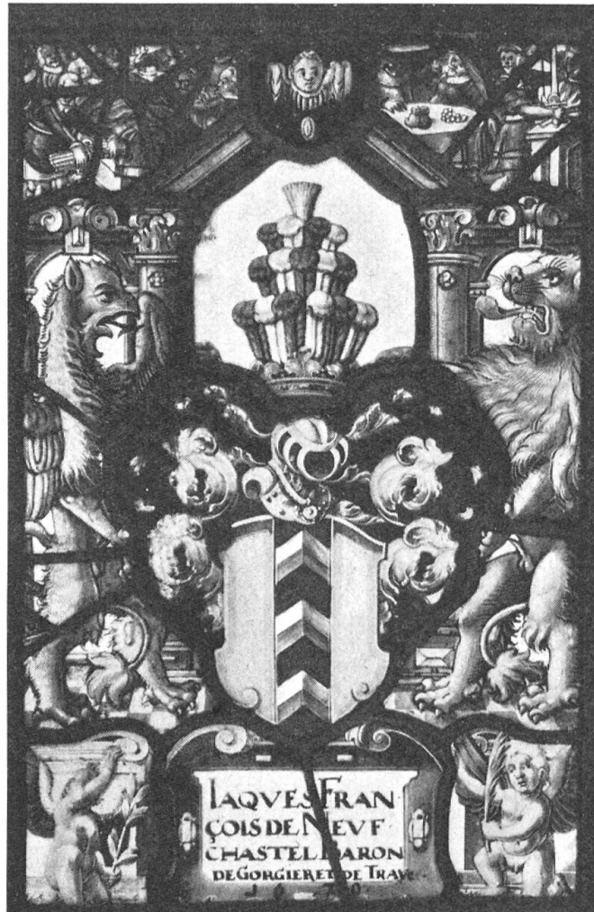
Fig. 38. Vitrail de Jacques-François de Neuchâtel.

Le cimier est une touffe de plumes d'abord arrondie (E 3, pl. XIX, 1934) qui se transforme en une sorte d'aigrette (pl. XX, 1934) puis en un bouquet de plumes d'autruche (E 12, pl. XX, 1934) qui prend une forme curieuse, par suite de la maladresse du